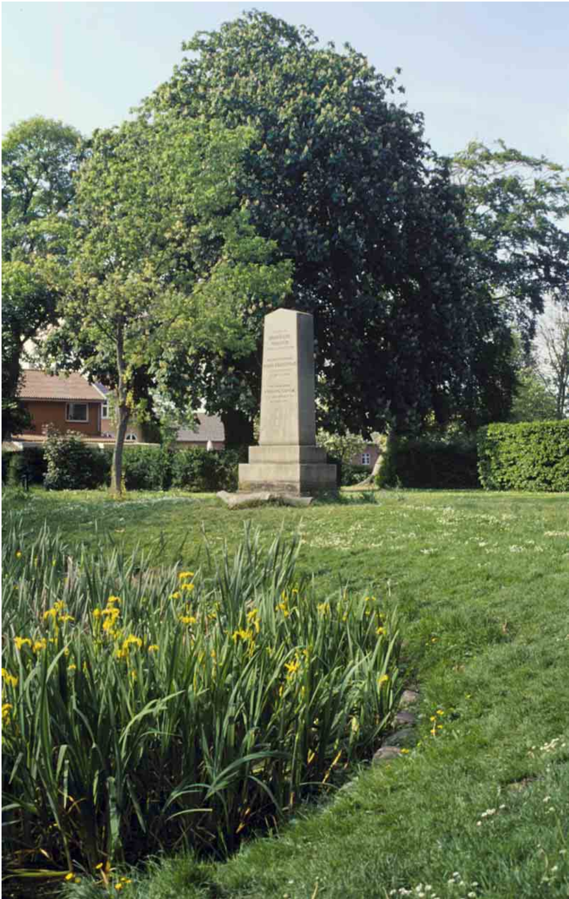
Mindestenen i Ørstedsparken står foran den lille sø med de gule liljer.

Kortlægning og registrering af kulturmiljøer