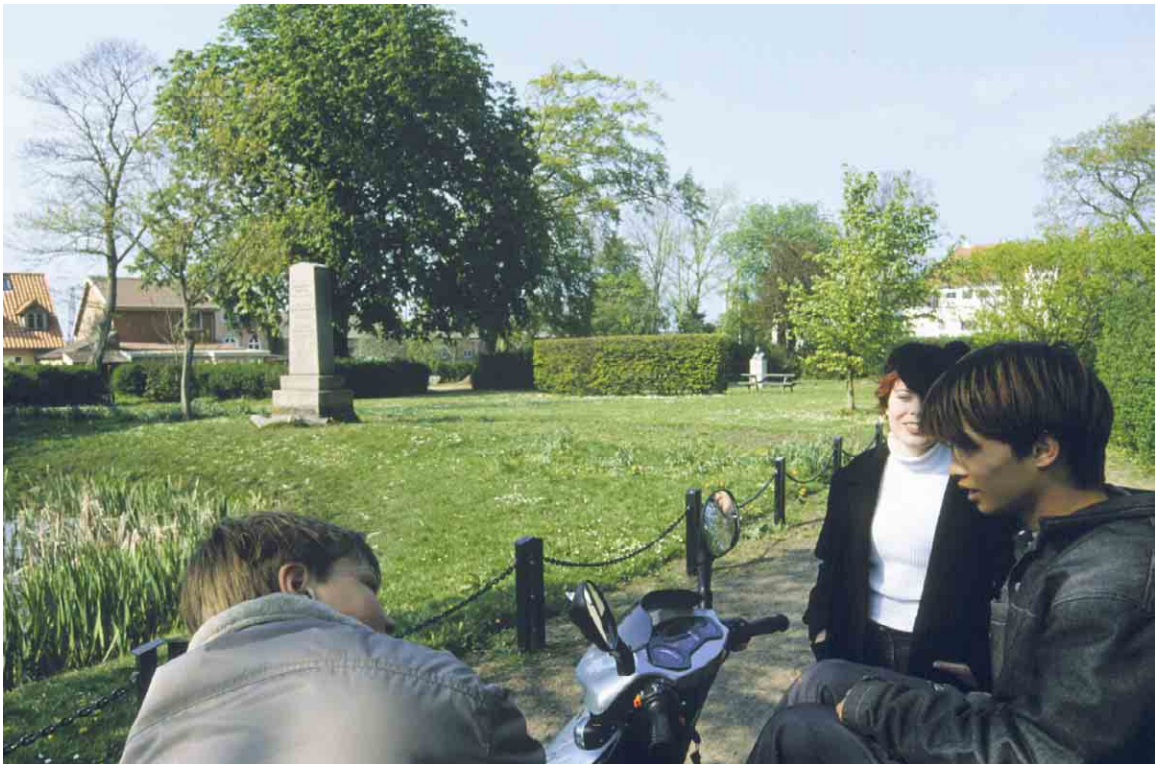
Ørstedsparken tiltrækker i dag først og fremmest et yngre publikum.

Som dekorationer og oplivende momenter er Ørstedsparken udstyret med en lille sø med mindsten og monumentale bronzestatuer.