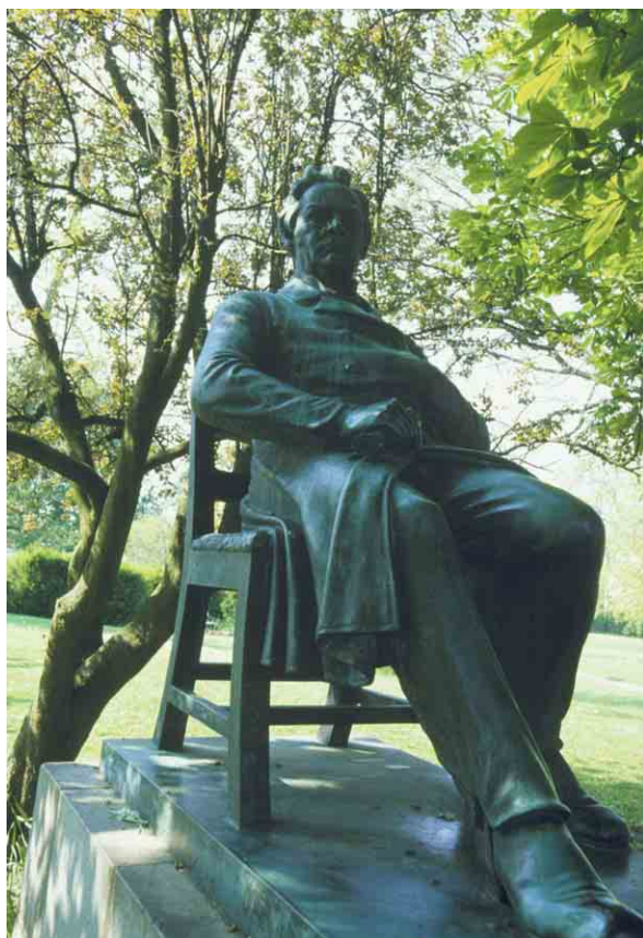
Anders Sandø Ørsted troner højt på sin bronzestol i Ørstedparken.