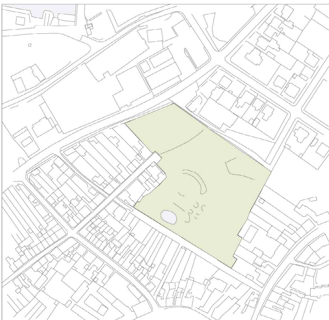
Ørstedsparken, kortudsnit i mål 1:2000

Ørstedsparken mellem Nørrebro, Havnegade, Platanvej og Sagers Allé var borgmester Sagers private jord med have, som borgmesteren tilbød byen mod at området blev omlagt til park. Haven åbnede for offentligheden i 1884, men omlæggelsen til park med pavillon skete først i 1906.