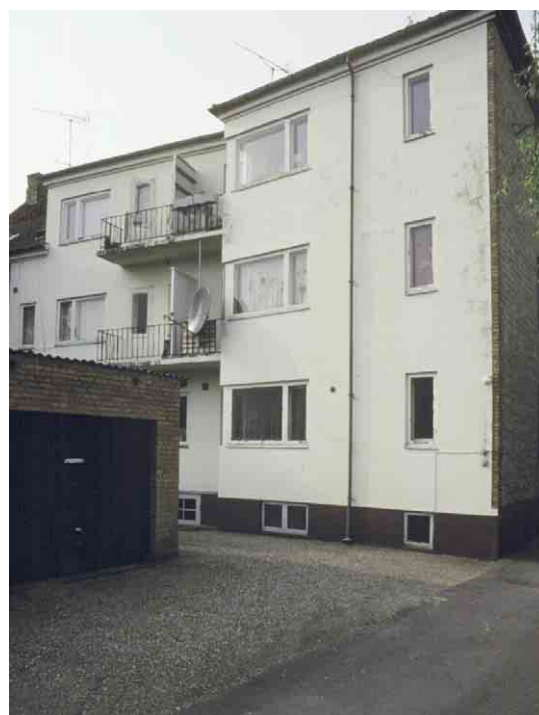
Mod gården har Nørrebro 22 alle funktionalismens kendte træk - den hvidpudsede facade, de store altaner og hjørnevinduerne.