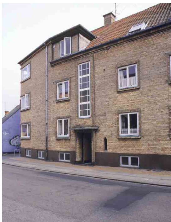
Nørrebro 22 har til gadesiden en nyklassicistisk facade.

På Nørrebro 57 - 59 opførtes i 1910 Rudkøbing Elektricitetsværk. Bygningens arkitekt var den senere så navnkundige Poul Bauman, der sammen med Kay Fisker hørte til den tidligste generation blandt danske arkitekter, som gjorde hele udviklingen med fra nyklassicismen i 1920'ernes slutning over tredivernes modernisme til efterkrigstidens funktionelle tradition.