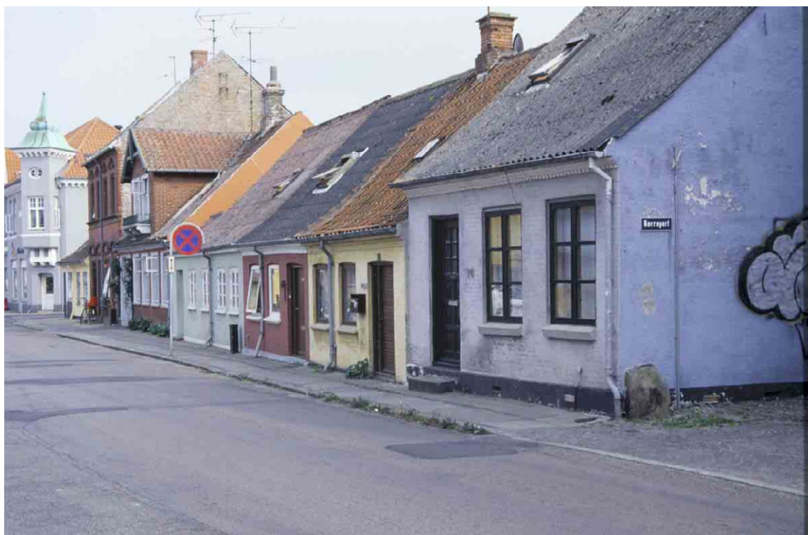
Rudkøbings tidlige arbejderklasse boede i de små 3-fags huse på Nørrebro.

Nørrebro har en pendant i Østergades yderste del, men dette gadestykke blev hurtigt inddraget til butiksformål og til dels ombygget. Nørrebro fik også butikker, men kun til dækningen af lokalbefolkningens behov.