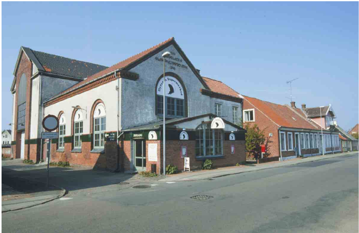
Rudkøbing Elektricitetsværk skyder sig ind mellem gadens småhuse.

Nørrebro er med andre ord en nybyggergade. Den sammensættes af to store rum, det inderste som er en runding af landevejen blev bebygget med håndværkerhuse iblandet nyindustrier som jernstøberi, garveri og enkelte nye købmandsgårde ca. 1840-1860, og det yderste som er udstukket efter en lineal og bebygget som et arbejderkvarter ca. 1860-1880. Byens elektricitetsværk opførtes i 1910 på Nørrebro 57-59. Stykket af gaden hed tidligere Nørrestræde. Navnet Nørrebro optræder fra ca. 1865.