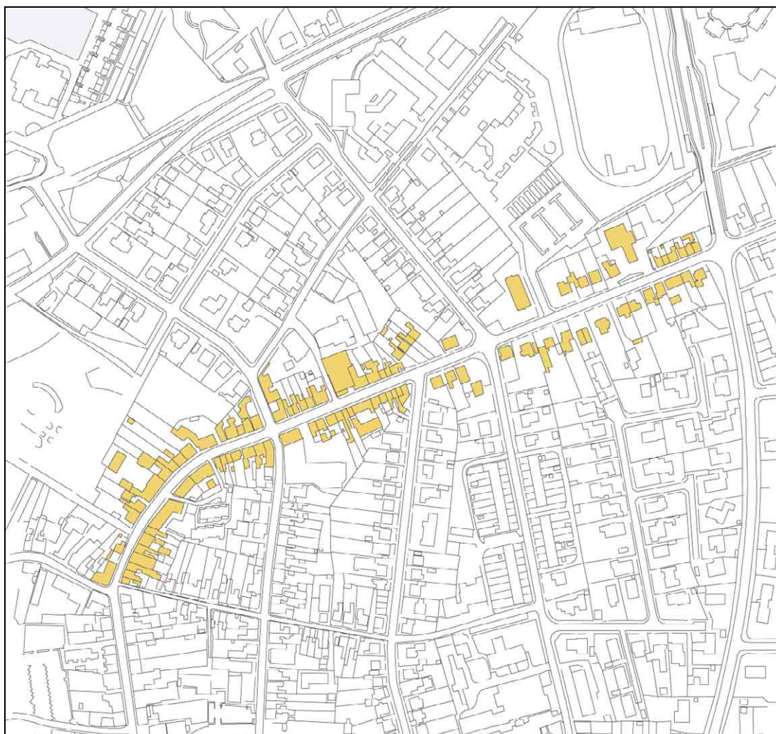
Nørrebro, kortudsnit i mål 1:4000

Nørrebro er et bebygget stykke af landevejen fra nord til byen. Den rummer velbevarede udviklingstræk og huse fra en bestemt tidsperiode i Rudkøbings historie. Gaden sammensættes af to rumlige afsnit, det inderste er en runding af landevejen som blev bebygget ca. 1840-1860 med håndværkerhuse, enkelte købmandsgårde, industrier og erhvervs-ejendomme, det yderste er udstykket efter en lineal og bebygget som et arbejder- og industrikvarter ca. 1860-1880. Nørrebro er repræsentativ for 1800-årenes byudvikling. Bebyggelsen har bevaret det oprindelige udtryk på trods af ombygninger og facadeændringer og fremstår som et kulturmiljø af betydning for Langelandsområdet.