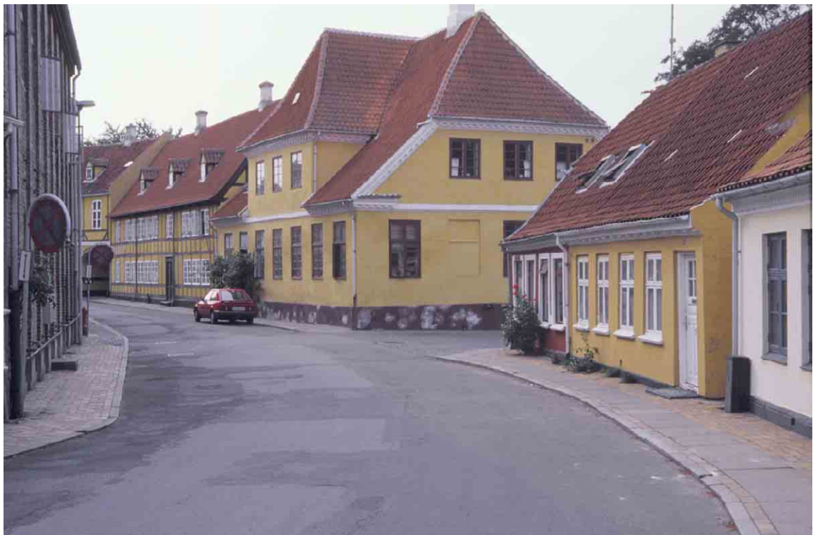
Nørregade 21 er Rudkøbings første grundmurede hus. En stor og svær bygning med helvalmet frontkvist til gaden.

På Sidsel Bagersgade 11 ligger et beskedent byhus fra 1700-årenes sidste halvdel med kvistetage fra 1846. Endelig findes byens sprøjtehus fra 1834 på Grønnegade 13/Smedegade 1, opført i klassicistisk stil af murermester Fr. Nielsen.