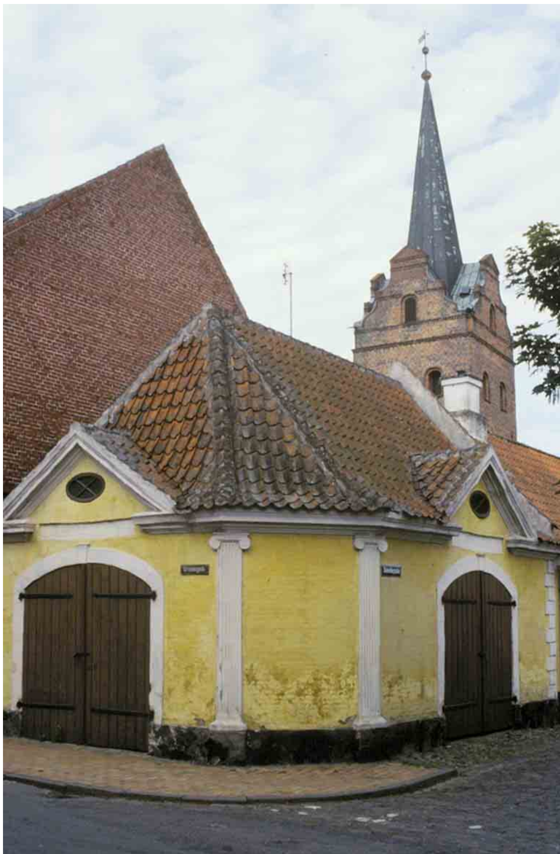
Byens sprøjtehus med dobbeltport og joniske pilastre.

Kortlægning og registrering af kulturmiljøer