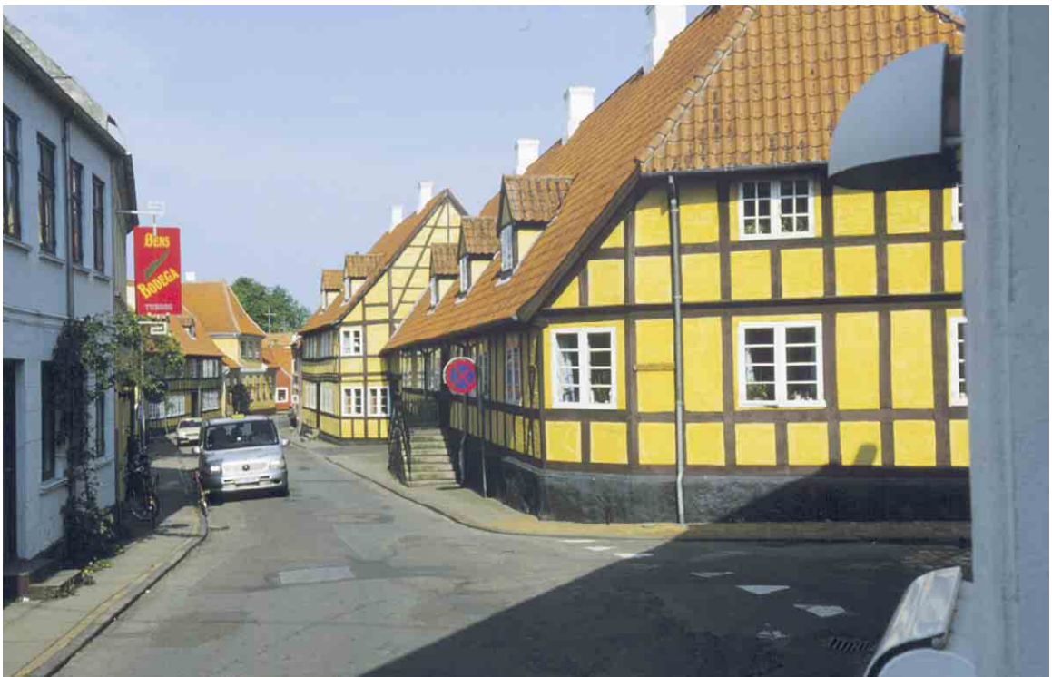
De store dominerende købmandsgårde i Nørregade fortæller om gadens betydning som byens indfaldsvej fra nord.

Det gamle velbevarede byrum med flere fredede ejendomme vidner om en stabil plads i bylegemet og udgør et væsentligt, repræsentativt og identitetsgivende kulturmiljø med bevaringsværdier af betydning for landet og langelandsområdet.