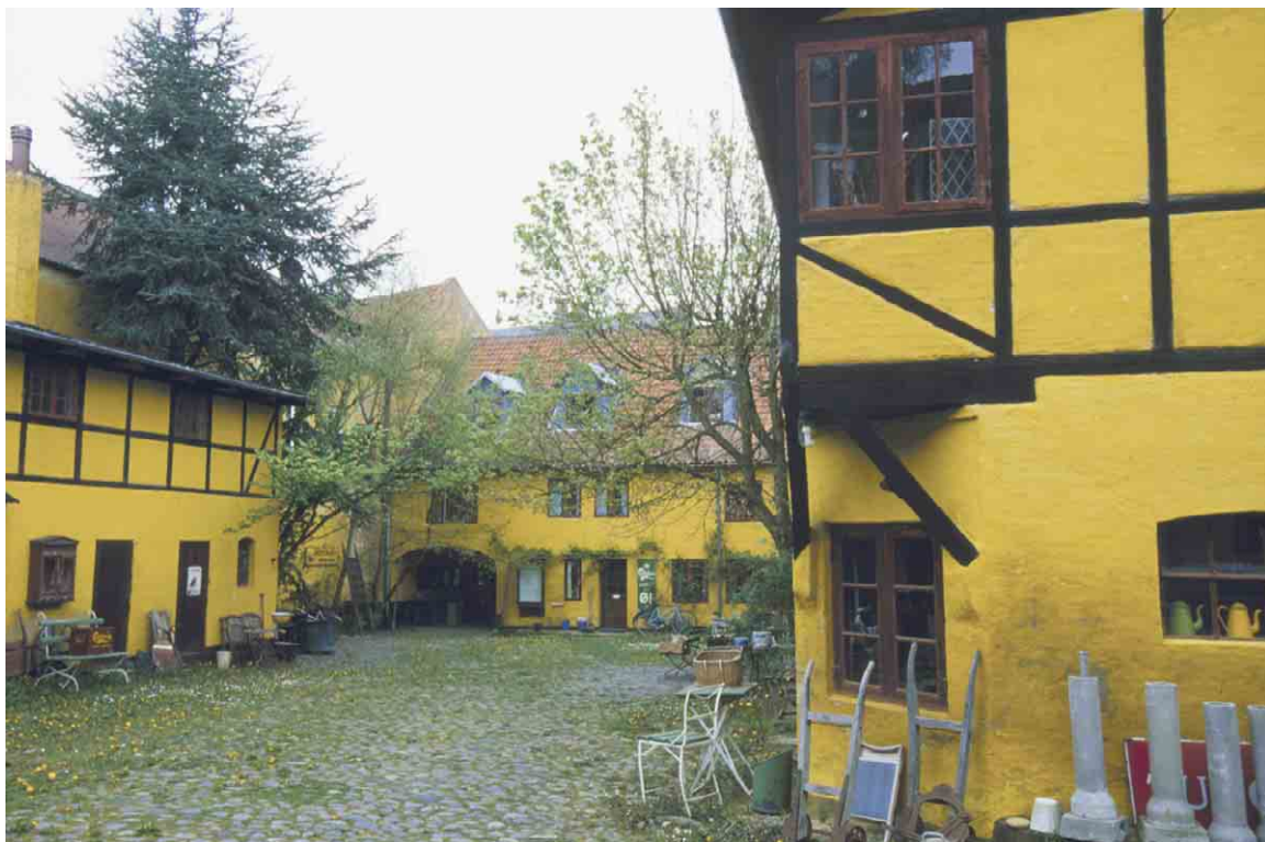
Østergade 16 - 20 har en meget charmerende gård hvor de gule længebygninger omslutter det intime rum.

Kortlægning og registrering af kulturmiljøer