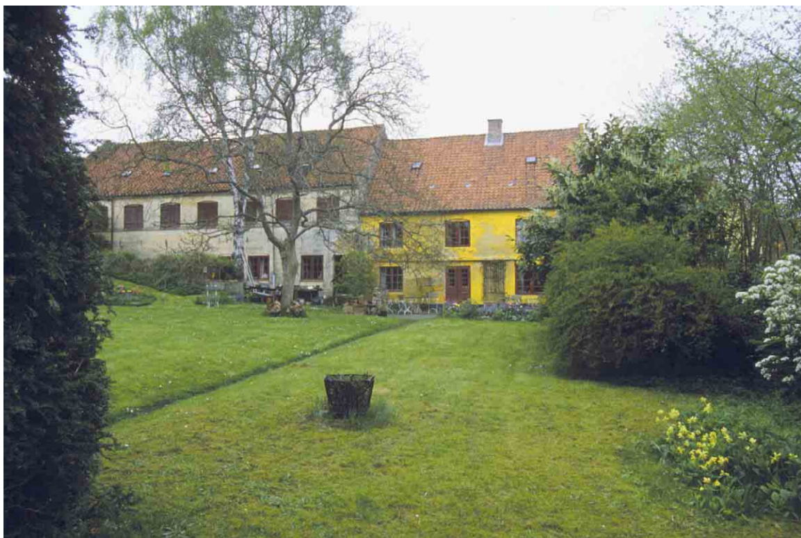
Foruden sit brolagte gårdrum har Østergade 16 - 20 ligeom de andre store ejendomme i gaden, have ned mod Vejlen i syd.