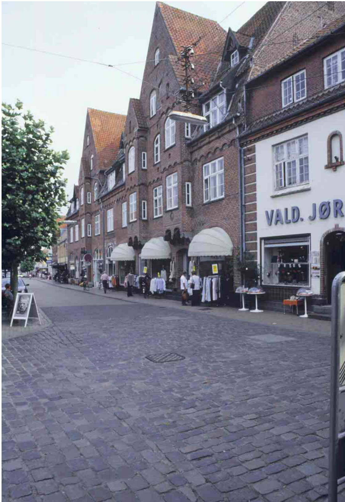
Østergade 36 - 38 er et magtfuldt byggeri i Renæssancestil, opført i 1913 i forbindelse med en omlægning af gaden.

Kortlægning og registrering af kulturmiljøer