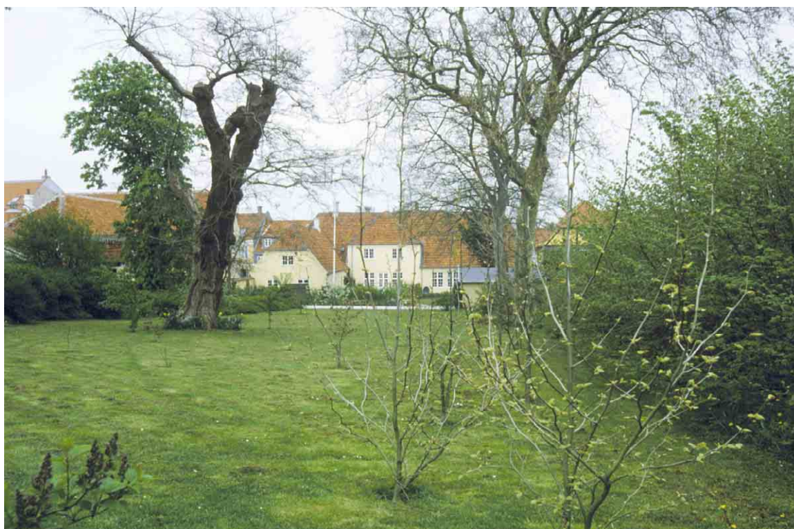
Baghaven til præstegården i Østergade 2 er karakteristisk for de store ejendomme i gaden.

Længere inde mod byen ligger byfogedens gård i nummer 16 - 20. Begge ejendomme er karakteristiske ved deres kompleksitet med side- og baghuse og deres store haver, som løber ret ned til Vejlen syd for byen. Længere ude i Østergade 36 - 38 i overgangen mellem den gamle og nye del af gaden er i 1913 rejst et mægtigt byhus i renæssancestil. Det bryder markant med gadens skala, men er alligevel en berigelse til gaderummet.