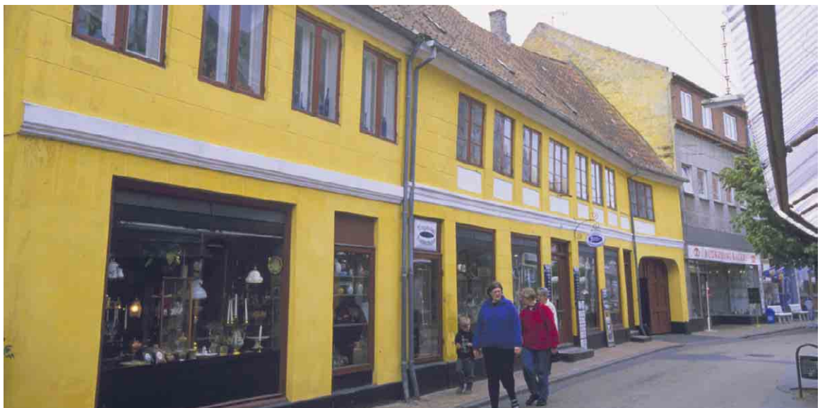
Byfogedens gård i Østergade 16 - 20 står særdeles synlig med sin gule kalk i gades bue.

Senere medførte asfalteringen og fra 1960'erne butiksfacaderne og gadeinteriørets tilpasning til de bilkørende at gaderummet blev uæstetisk, uigennemsigtligt og slidt. Først i de senere år er der rettet op på skaderne, bl.a. ved atter at indrette gaderummet til de gående. Men for at takkes dem har man på en meget uheldig måde plantet træer som udvisker det åbne, buede rum med de karakteristiske bygningsfacader, som er gades kulturhistoriske hovedtræk.