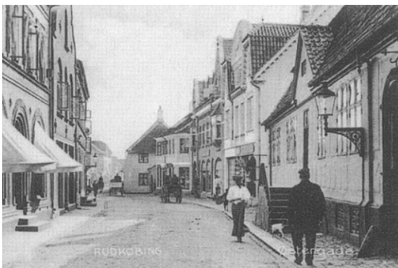
Østergades indre krumme del var, som det gamle postkort viser, tidligere afskærmet fra den ydre retlinede del af det fremspringende gavlhus i nr. 34. Foto ca. 1907.