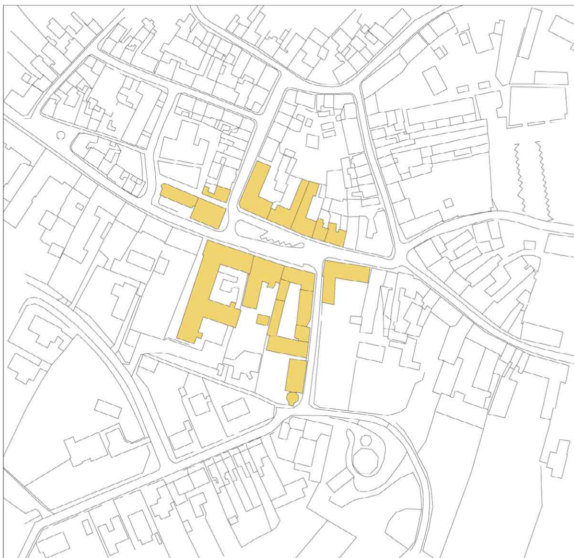
Torvet, 1: 2000

Torvet ligger for enden af Rudkøbings to hovedgader. Det har fra begyndelsen fungeret som bymidte og bysamfundets offentlige rum med kirke og retsudøvelse. Pladsen blev også benyttet til handel og omsætning med landboerne, især af varer til byens egen konsum, men også af varer til videresalg. For at alle fik den kortest mulige vej til bymidten findes den altid for enden af hovedgaderne.