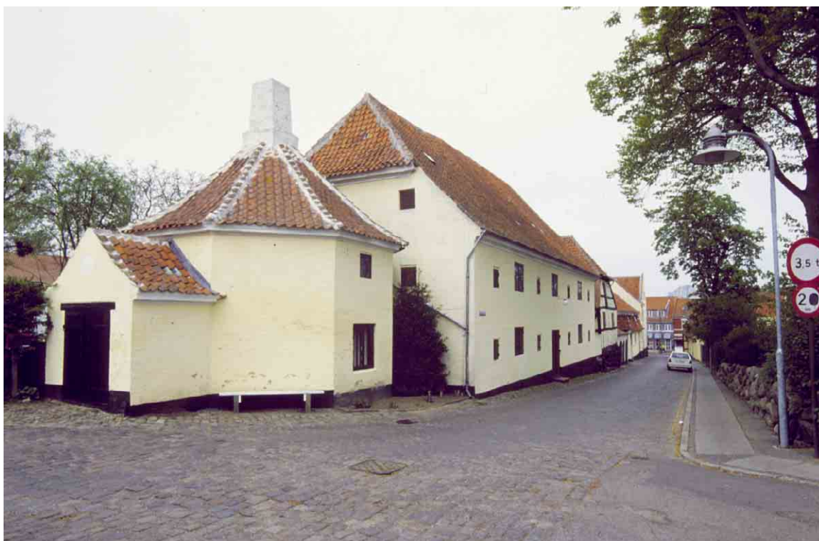
Torvet 6, set fra Ruestræde var en af Rudkøbings betydeligste købmandsgårde.

Kortlægning og registrering af kulturmiljøer