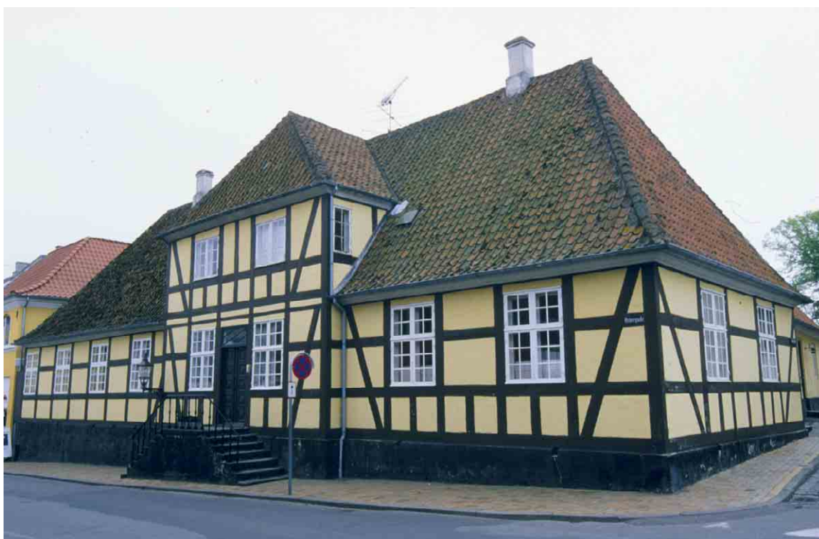
Præstegårdens solide bindingsværk lukker Torvets østende og formidler overgangen til Østergade.