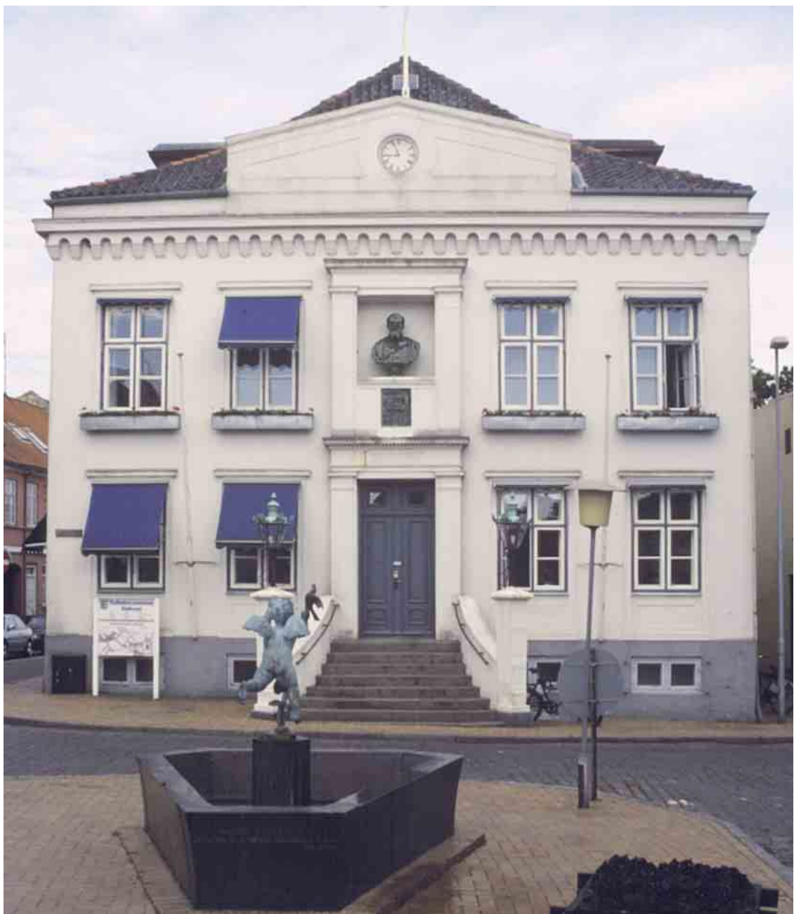
Rudkøbing Rådhus har hovedfacade i gavlen mod Torvet.

Kirken dominerede hele det store rum indtil opførelsen af et rådhus på Torvet. Der kendes til rådhus i Rudkøbing fra middelalderens slutning, men de var oprindeligt beskedne. Det ældst kendte brændte i 1580 eller 1610, og det efterfølgende gik til under svenskekrigene i 1659 som lagde byen og rådhuset i ruiner. Indtil 1791 lå de utvivlsomt ganske beskedne rådhus med gavl mod Torvet og bagside langs kirkegårdens gærde. Det nye rådhus vendte facaden mod Torvet og ryggen mod småkårshusene som åbenbart ikke tjente byen til ære.