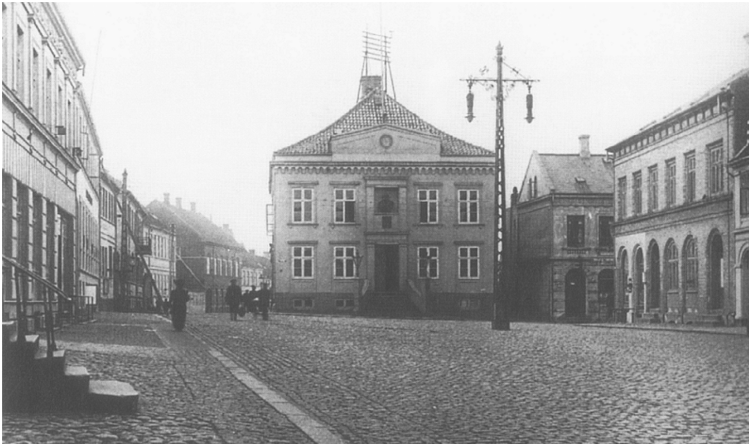
Det gamle fotografi af Torvet med den ensartede brolægning viser det "nøgne" byrums fine kvaliteter. Foto fra ca. 1920.

Torvet er repræsentativt for middelalderens handelskøbstæder og tillige velbevaret og identitetsgivende for Rudkøbing. Med den stilistisk klart afgrænsede bygningsmasse, de velbevarede offentlige bygninger og de klare proportioner danner Torvet i Rudkøbing et kulturmiljø af betydning for landet. Bevaringen af torverummet kræver dog, at dets brolægning, bygninger og oprindelige funktioner vedligeholdes.