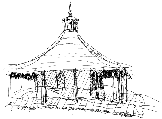
Den kinesiske pavillon i Slotsparken, Tranekær

M Matthiessen, Christian Wichmann m.fl.: De nye tider - hvordan industrialiseringen forandrede vores dagligdag. Nationalmuseet 1979. Matthiessen, Hugo: Gamle Gader og Gaarde i Rudkøbing. Architekten XIX. 1917; s. 173-177, 181-185 og 191-197. Møllerup, Jens: Rudkøbing - dengang. Byen i billeder 1865-1915. Rudkøbing 1984. Møllerup, Jens: Sundhed og sygdom. Rudkøbing 700 Aar. Rudkøbing 1987; s. 148-158. Møllerup, Jens: Rudkøbing - dengang. Byen i billeder 1916-1965. Rudkøbing 1999.