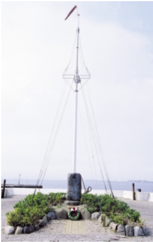
På Rudkøbing havns midtermole er rejst dette minde for faldne danske søfolk under 2. Verdenskrig.

A Ahlefeldt-Laurvig, F.: Generalen I-IV. 1929-1931.