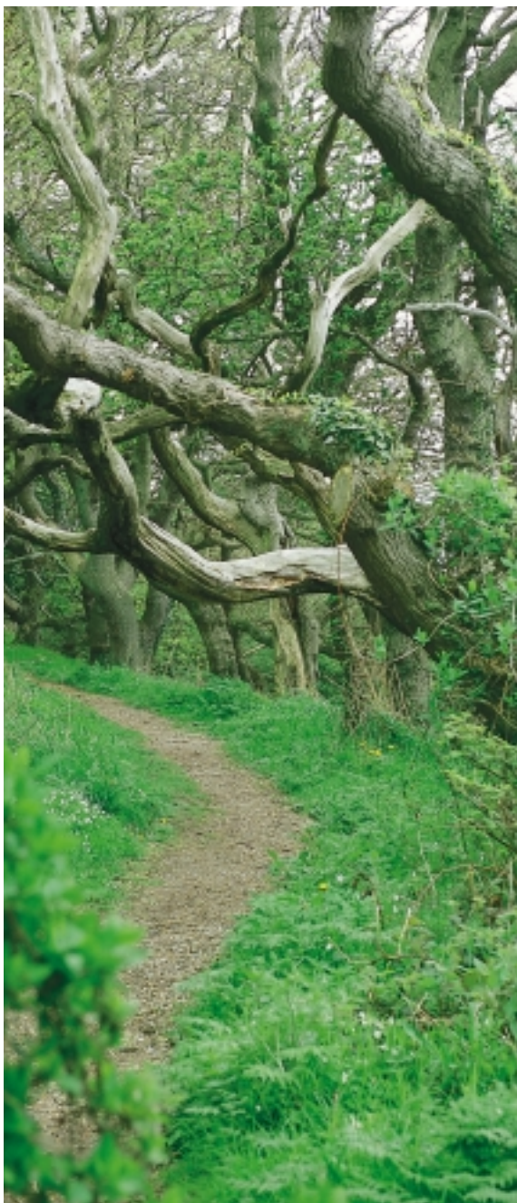
Gærdselsskovene eller stævningeskovene på Sydlangeland udgør et spændende stykke kulturhistorie.