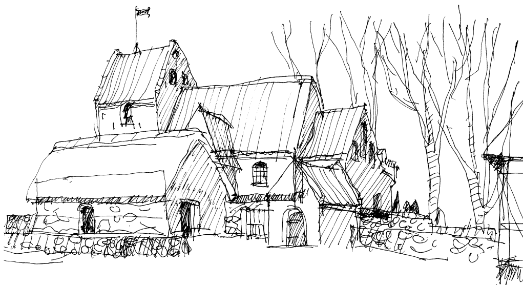
Tryggelev Kirke og den foranliggende kirkelade udgør et enestående og særpræget stykke bygningskultur.

Langelands havne er inde i en udvikling, hvor en række af de traditionelle havneaktiviteter som fx færgedrift, banevirksomhed, værftsindustri og andet er under afvikling. Til gengæld trænger andre aktiviteter sig på - fx ferielejligheder, kongres- og mødesteder eller simpelthen byudvikling med boligbyggeri. Havnene indeholder under alle omstændigheder store potentialer, som bør udvikles med respekt for de ofte meget originale miljøer, som er tilstede i havnene.