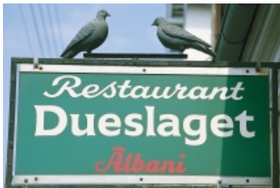
En bogstavelig og charmerende skiltning fra Havnegade i Rudkøbing.