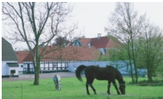
Landlig idyl ved Hjortholm, set fra en lidt usædvanlig vinkel nord for gården.