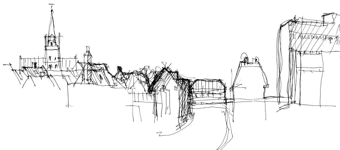
Rudkøbings profil - vinklet mellem kirken og Langelands Kort.

Med udgivelsen af Langeland atlas er der skabt et overblik over øens bevaringsværdige kulturmiljøer og enkeltbygninger. Det er følgegruppens håb, at det fælleskommunale atlas må medvirke til en koordineret og afstemt indsats i de tre kommuner.