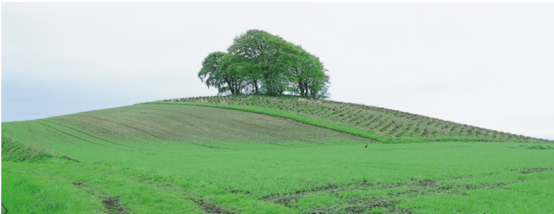
Hatbakke ved Vindebyvej 10. Trægruppen på toppen forstærker bakkens vertikal.