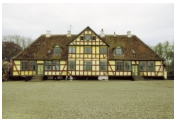
Søvertorps barokke hovedhus fra 1600-årene er med sit valmede tag og store frontkvist et smukt eksempel på Langelands ældste bindingsværk.