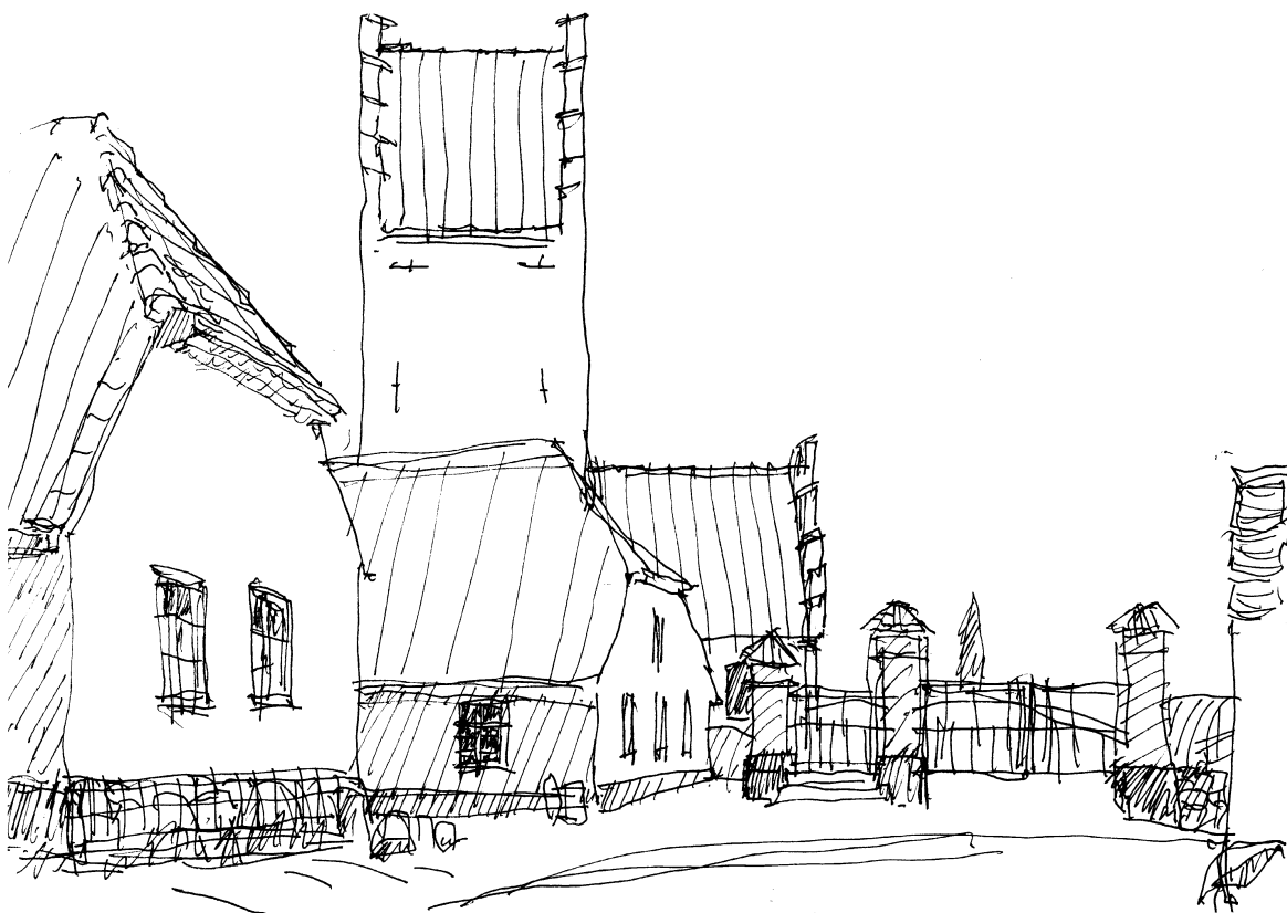
Fodslette er en af Langelands gamle adelbyer. Kirketårnet hæver sig 'stumt' over den foranliggende skolebygning.