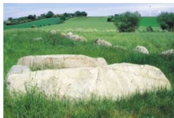
Hesselbjerg Langdysse er en af de markante storstensgrave fra den tidlige bondestenalder.