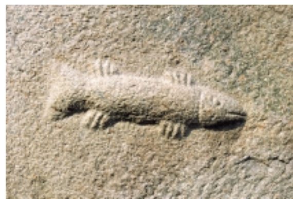
De romanske stenhuggere har på flere af Langelands kirker efterladt sig kraftfulde og livlige relieffer. Fisken her ses på Snøde kirkes sydside.