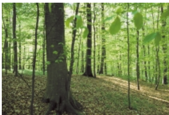
Lave volde og terrasser i skovene på Hov angiver jernalderbondens marker. Som her i Vestre Stigehave.

Af stående bygninger er kirkerne og Tranekær Slot de eneste fra middelalderen. Af verdslige bygninger opført før 1800 findes enkelte andre hovedgårde - Søvertorp, Hjortholm og Brølkøkke - samt bindingsværkshuse i Rudkøbing og på landet.