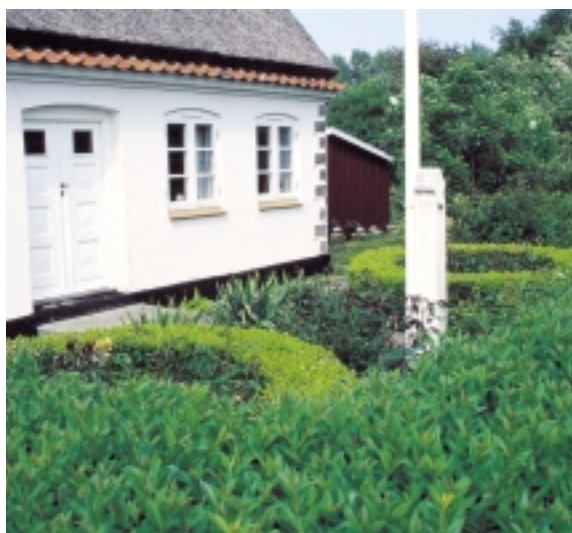
Sirligt arrangerede for haver forekommer mange steder på Strynø. Som her ved Møllevejen.