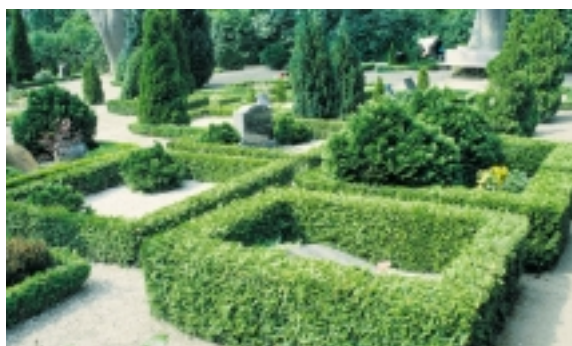
Flere af Strynø Kirkes gravsteder står særlig formfaste på grund af den selvstændige hegnsplantning på alle sider.