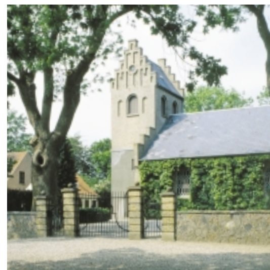
Strynø kirke ligger smukt bag kirkepladsens høje træer.

På brohovedet opførtes et lille læ- og pakhus, som i en nyere version står på samme sted. Broen fik stenbelægning omkring 1925, og telefon og el i begyndelsen af 1930'erne. En både- og jollehavn på sydsiden er anlagt i 1920'erne. I 1954 blev der indrettet et egentlig færgeløbe for at lette af- og tilkørslen. Strynø fik egen bilfærge i 1966, da Syd-fynske Dampskibsselskab ophørte med besejlingen.