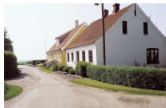
Ved Skippergades udmunding i Ringgaden åbnes for udsigt over markerne og øhavet mod Strynø Kalv.