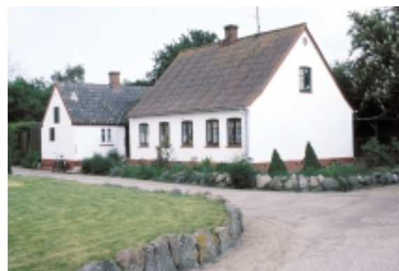
På Skippervej 5 står dette lille, fine og renfærdige bygningsemsemble.