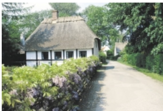
Op ad Kirkevej hænger blåregnens graciøse blomsterklaser ud over vejskellet.