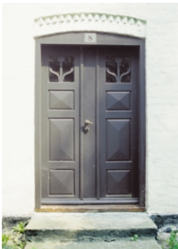
Livstræsprossen er et særkende for dørenes vinduesudsmykning på Strynø.

Fra midten af 1800-årene havde øhavets hastigt voksende handelsflåde behov for arbejdskraft. En del af befolkningstilvæksten på Strynø fandt beskæftigelse ved at tage hyre i flåden, og kunne dermed forblive på øen i stedet for at rejse væk. Mere og mere godstransport flyttede dog efterhånden over på mange jernbaner, som blev anlagt i perioden ca. 1870-1910, og da handelsflåden efterfølgende gik fra sejl til motor, svandt behovet for arbejdskraft ind.