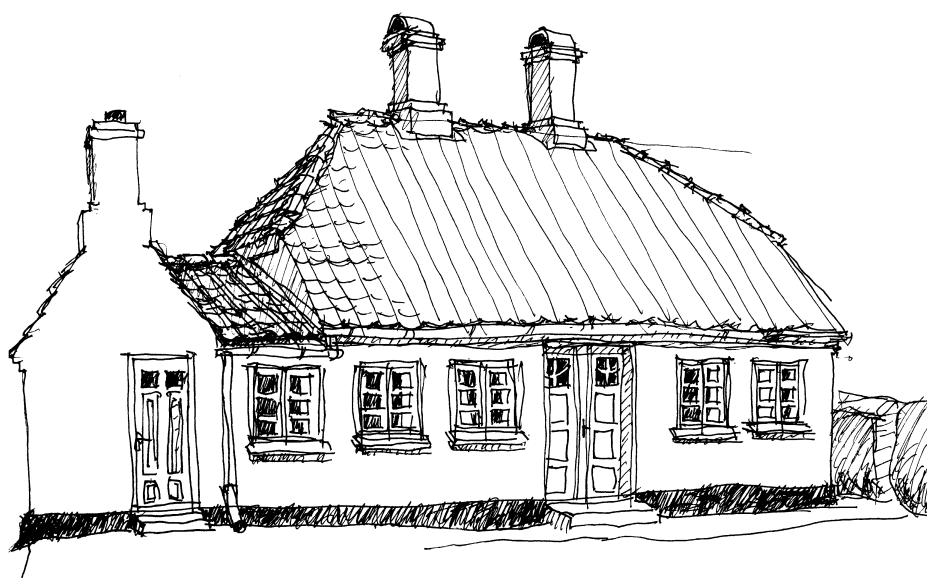
På Stjernegade er et andet af de små sømandshuse indfanget. Her forsynet med to høje skorstenspiber og det karakteristiske, tværstillede anneks.

Livstræsprossen fra Strynø er kun registreret et enkelt sted uden for øen, så sprossemesteren har været at finde blandt øens snedkere.