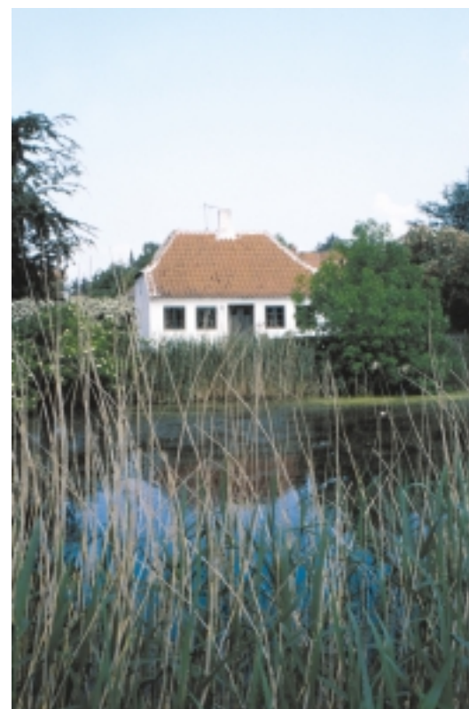
Strynø har en spændende bygningshistorie. Ved gadekæret Postens Dam, først for i byen, ses et af Pe' Bagers små femfags huse.

Strynø blev udskiftet i 1810. Man anvendte en blandet stjerne- og blokudskiftning til henholdsvis de større og de mindre gårde. Stjerneudskiftningen udgik fra landsbyen og optog det meste af øens midterste del. Blokudskiftningen blev udlagt omkring to parallelle veje i nord og syd.