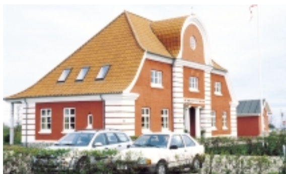
Spodsbjerg Station er, som de to øvrige af Langelandsbanens endestationer, ekstraordinært rigt udstyret.

Foran tilkørselsarealerne til færgen ligger Langelandsbanens fornemme stationsbygning, som i Spodsbjerg har fået sin helt egen udgave. Pudset og rødmalet og med et imponant midterparti, adskiller den sig fra banens øvrige stationsbygninger.