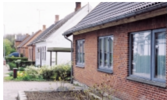
På Tom Knudsensvej er husenes placering stramt styret af vejbyggelinjen.