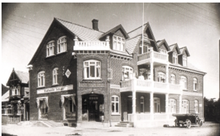
Der var format over datidens indkvartering. Her ses badehotellet Solvang fra 1913 på hjørnet af Spodsbjergvej og Pederstrupvej. Foto fra 1920'erne.