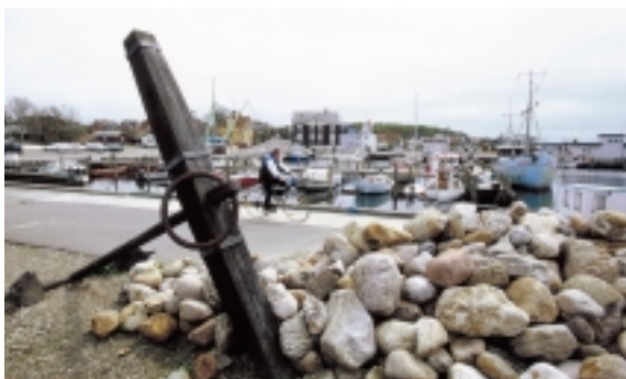
Lohals er en af Langelands fire gamle færgehavne. Den sidste færge sejlede i 1998, da forbindelsen til Korsør blev indstillet.