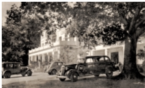
Det gamle fotografi giver et godt indtryk af det mondæne liv blandt datidens badegæster. Foto fra begyndelsen af 1940'erne.