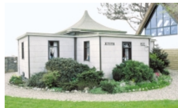
Der er opført mange spøjse sommerhuse i Spodsbjerg. Fx her, hvor pagodetaget strækker sit beskyttende tagudhæng ud over husets firkantede kasser.