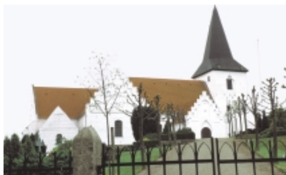
Magleby kirke kan ses vidt om. Den står som et kendsingsmærke i landskabet.