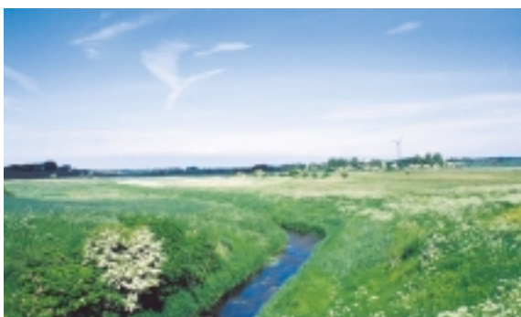
De snorlige afvandingskanaler skærer sig ned i norets flade bund.