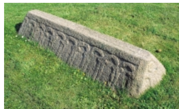
En fint tilhugget romansk gravsten neden for kirketårnet fortæller om de gamle stennemestres fortrolighed med den hårde granit.

Det store tørlagte nor med dets grøfter, pumpestation, sluse og mindsten udgør et sammenhængende kulturlandskab af stor betydning.