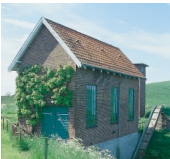
Pumpestationens nyttebetonede arkitektur tegner sin skarpe profil mod himlen.

vandhøjde. Et nyt stort afvandings- og opdykningsarbejde blev gennemført i 1944-46.