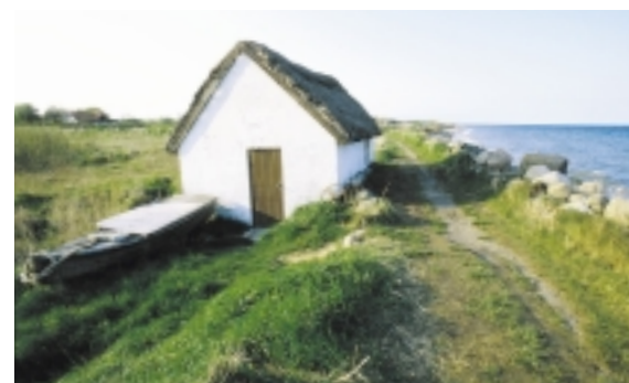
På strandvolden mellem moserne ved Østerskov og Langelandsbæltet har fritidsfiskerne rejst deres grejskure.

Denne måde at indbygge banelegemet og stationen i byplanen har været anvendt over hele landet. Den har både en funktionel baggrund - idet jernbanen ofte tangerede den eksisterende by og derfor havde behov for en vejforbindelse til byen - men også en arkitektonisk, idet vejstykket satte den nye stationsbygning i perspektiv.