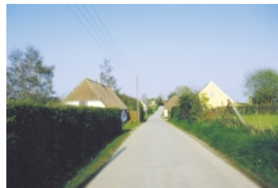
Østerskovvejs rette linjeføring understøttes af hækplantningen og husenes placering.