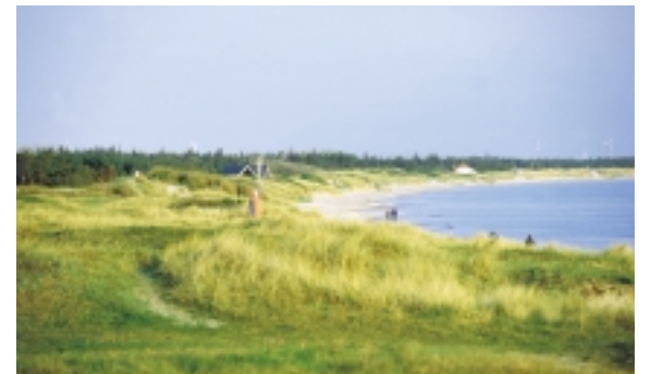
En dejlig sydvestvendt sandstrand står til rådighed for Ristinges bade- og sommerhusgæster.

Landsbyen, skibsbroen og sommerhusområderne udgør hovedelementerne omkring Ristinge. Sammen med nordet og klinten udgør de et sammensat og spændende kulturmiljø.