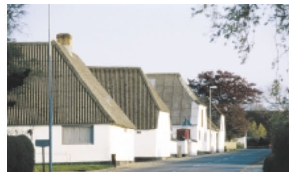
Gårdene i Ristinge står skulpturelt med udlængernes hvidkalkede gavle op mod vejen.