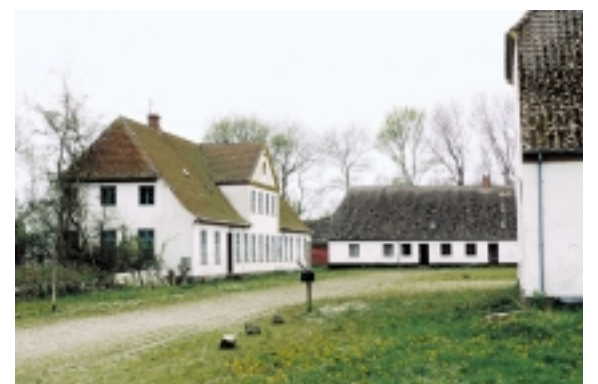
Søgård er en god repræsentant for Langelands mange større gårde. Et enkelt og velproportioneret anlæg.