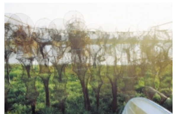
På stejlepladsen ved Ramshøj løber solens stråler gennem de vådglinsende garn.

Søgårds hvidkalkede bygninger med optrukne gesimsler og kampestenssokkel er fra 1857. Hovedbygningen er i en etage med afvalmet tegltag og en bred gavlkvist ud mod gårdspladsen.