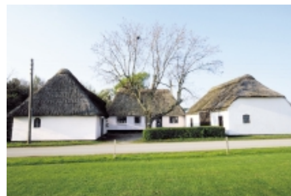
Østerskovvej 49 er et godt eksempel på den trelængede gård, der er så karakteristisk for Langeland. Fjerdesiden er markeret af hæk og træ.