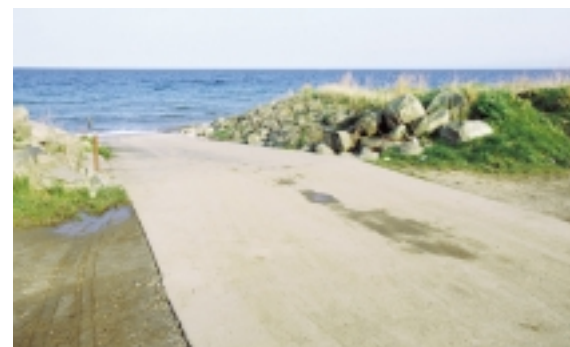
Østerskovvej løber i en næsten ret linje fra Tryggelev og lige ud i vandet.