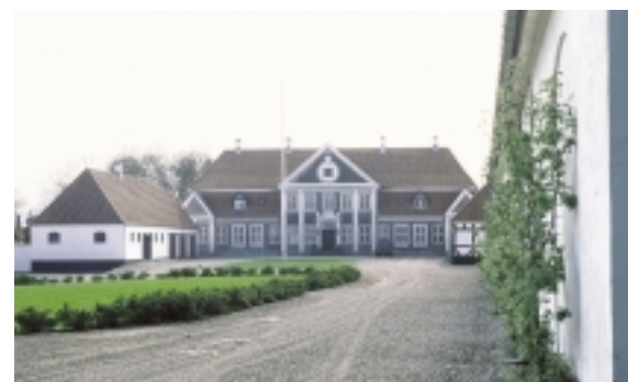
Hjortholms hovedbygninger udgør et samlet kompleks af stor variation og skønhed.