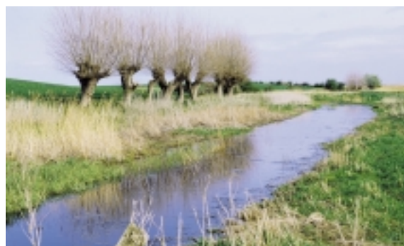
Det sydøstlangelandske hovedgårdslandskab er særligt smukt ved Påø Enge med blanke vandspejl og et rigt fugleliv.