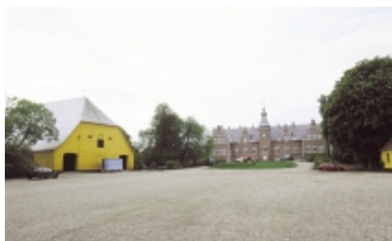
Fårevejles gårdsplads er enormt stor. Uden den aksefaste bebyggelse ville anlægget true med at falde 'fra hinanden'.

De karakteristiske bevoksede stendiger ses på et langt stykke af Kragholmvej.