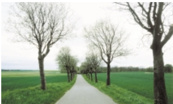
En forholdsvis nyplantet allé forbinder landsbyen med hovedgården.

Hovedgården Fårevejle og landsbyen Kragholm syd for Rudkøbing har hørt sammen gennem århundreder. De indgik i et karakteristisk hovedgårdslandskab, som bestod af hovedgården, beliggende i et afgrænset område med kystskove og engstrækninger, og en beskeden rydningslandsby.