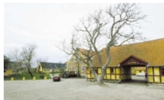
Kragholmgård benyttes i dag som efterskole. Gårdanlægget fremstår venligt og imødekomende i god samklang med efterskolens nybygninger.

Som følge af en voksende befolkning og et øget hoveribehov på Fårevejle steg antallet af huse i landsbyen fra tre i 1583 til tolv i 1767.