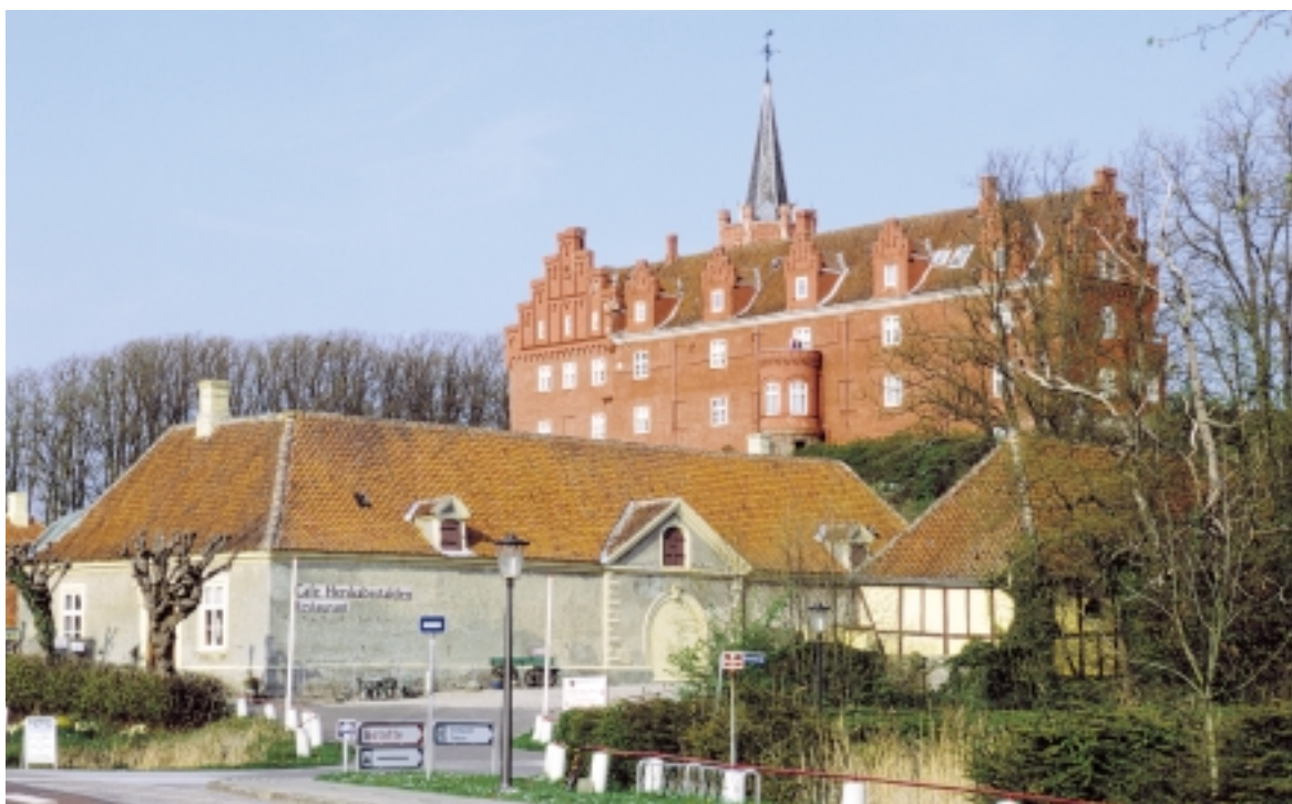
Tranekær Slot står med spir, kamtakkede gavle og røde mure som drømmen om et eventyrslot. Her ses slottet fra hovedgaden med Herskabsstalden nedenfor.

Tranekær ligger udspændt mellem kirke og slot. Imellem disse landemærker snor byen sig omkring landevejen, der slynger sig gennem landskabet. I den vestlige del af byen falder terrænet jævnt mod syd til vådområdet Flådet. For den østlige del af byen gør det omvendte forhold sig gældende. Her falder terrænet mod nord til de lave arealer omkring Tuemose.