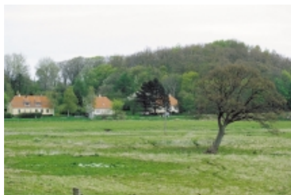
Over Flådet er der frit udsyn til Martin Nyrops tre gulkalkede landhuse. Byen venter bag den skovbevoksede hatbakke.