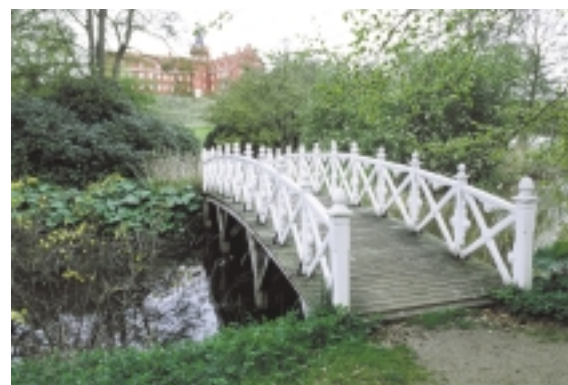
Slotsparken, som er anlagt i engelsk stil, er forsynet med et par 'kineserier' i form af tépavillonen ved foden af slotsbanken og træbroen, som fører over Slotssøen til slottet.

En smuk lindeallé skærer sig i lige linje gennem det nordlige terræn fra slottet til kirken. Alléen er anlagt af Frederik greve Ahlefeldt som en privat vej i midten af 1700-årene.