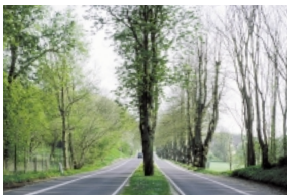
Den gamle, flotte lindeallé, der fører landevejen ind til byen fra nord, er ganske elegant udvidet med en ny kørebane, uden at alléen har lidt overlast.