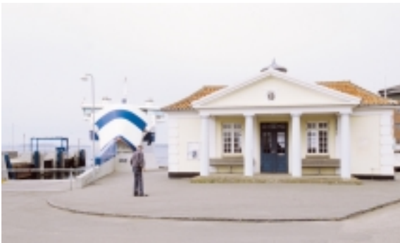
Den gamle ventesal med det fremhævede indgangsparti under tempelfronten, betjener i dag Strynø- og Marstal-færgens passagerer.