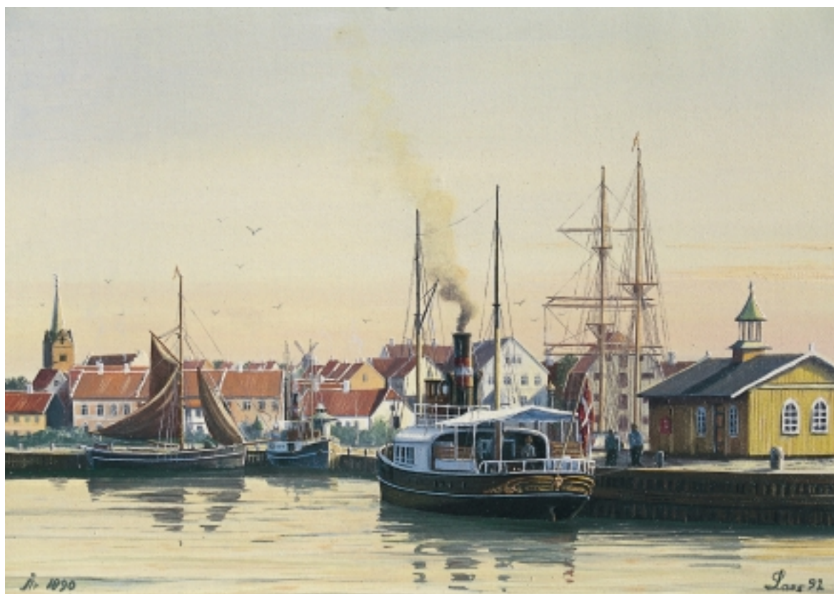
Maleri af Rudkøbing Havn med dampskibsfærgen 'Svendborgsund' i forgrunden. Maleriet er udført af havnemester Lass Andersen fra Sønderborg i 1992 efter et ældre fotografi fra 1892.

Samtidig med anlægget af det søndre bassin blev der i 1824 opført en toldbod ved Brogade og et havnehus på Bellevue 2. Toldboden blev i 1891 erstattet af den nuværende ved kgl. bygningsinspektør i Odense, Jens Vilhelm Pedersen, der tegnede adskillige bygninger for told- og postvæsenet i sit distrikt.