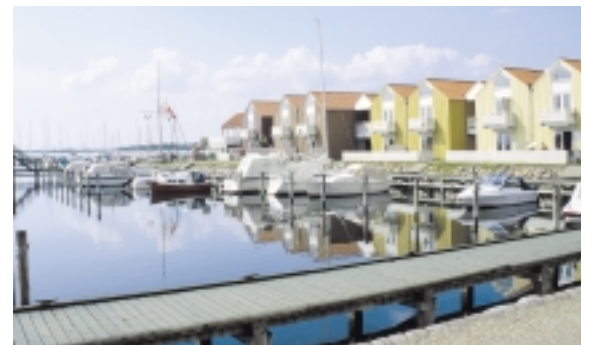
Rudkøbing Skudehavn opførtes som feriecenter i slutningen af 1980'erne. I dag er de fleste lejligheder udstykket og solgt. Der drives dog stadig hotel- og restaurationsvirksomhed på stedet.

På den søndre moles yderste led står D.F.D.S. pakhus fra 1916 - bygget af træ med tre gavlmarkerede porte på hver langside. Et pakhus på molens indre led, som blev bygget i 1908 til godsbefordrings-selskabet D/S Langeland, blev i 1970 indrettet til havnefogedkontor.