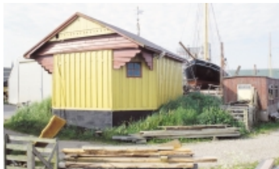
Spilhuset ved ophalerpladsen er et fint lille træhus, som i sin udformning giver mindelser om nordisk skønvirke.

I årene 1933-1938 blev der anlagt en bådhavn på et opfyldt terræn nordøst for fiskerihavnen. Som et sidste skud på stammen blev der i 1989 bygget en ny, stor lystbådhavn, Rudkøbing Skudehavn, med hotel og restaurant, nord for den gamle lystbådhavn. Skudehavnen tilstræber med sine gavlvendte træhuse i lyse pasteller at medgive et let og maritimt indtryk. Havnen er tegnet af Malthas tegnestue i Aalborg.