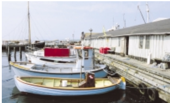
Fiskerihavnens særlige miljø underbygges af redskabs- og garnskurene, som nærmest omslutter bassinet og vender ryggen til den øvrige havn.