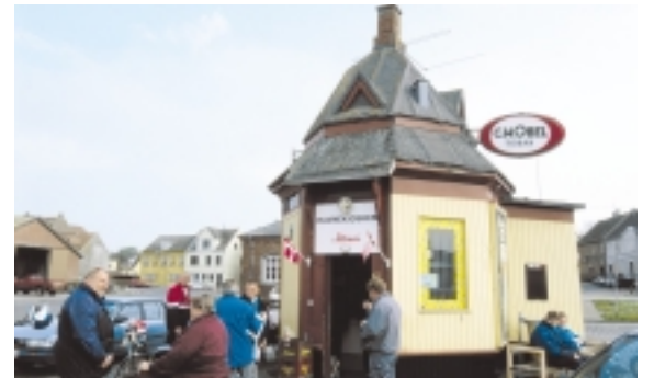
Midt på Havnepladsen står den lille ottekantede kioskbygning med sin faste stok af stamkunder omkring sig.

I årene 1933-1938 blev der anlagt en bådhavn på et opfyldt terræn nordøst for fiskerihavnen. Som et sidste skud på stammen blev der i 1989 bygget en ny, stor lystbådhavn, Rudkøbing Skudehavn, med hotel og restaurant, nord for den gamle lystbådhavn. Skudehavnen tilstræber med sine gavlvendte træhuse i lyse pasteller at medgive et let og maritimt indtryk. Havnen er tegnet af Malthas tegnestue i Aalborg.