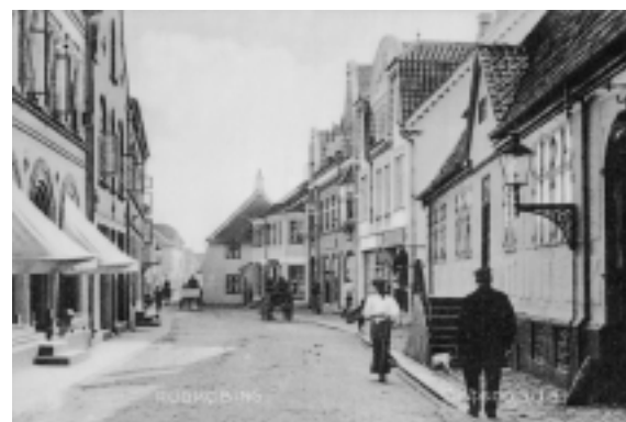
Østergades indre krumme del var, som det gamle postkort viser, tidligere afskærmet fra den ydre retlinede del af det fremspringende gavlhus i nr. 34. Foto fra ca. 1907.