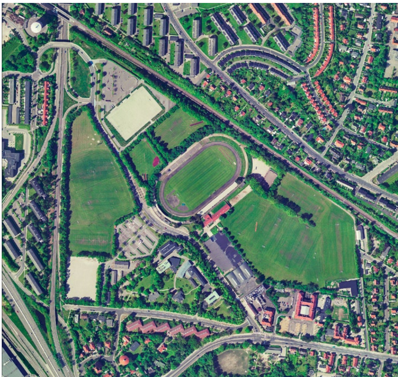
Ortofoto, Gentofte Stadion, 1:5000.