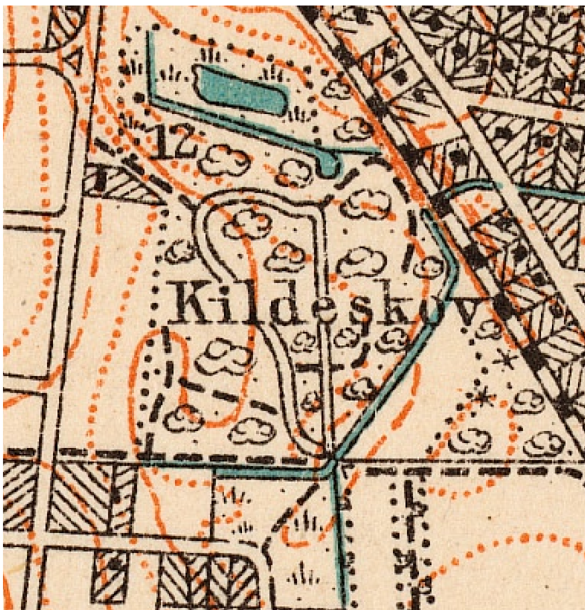
Historisk kort. Kildeskovhallen. Målt 1899 og rettet 1914, 1:2.500.

Kildeskovshallens konstruktion med et tagbærende rumgitter og facadens mange tætstillede søjler korresponderer med de omkringstående træers spejlinger i facadens glaspartier.