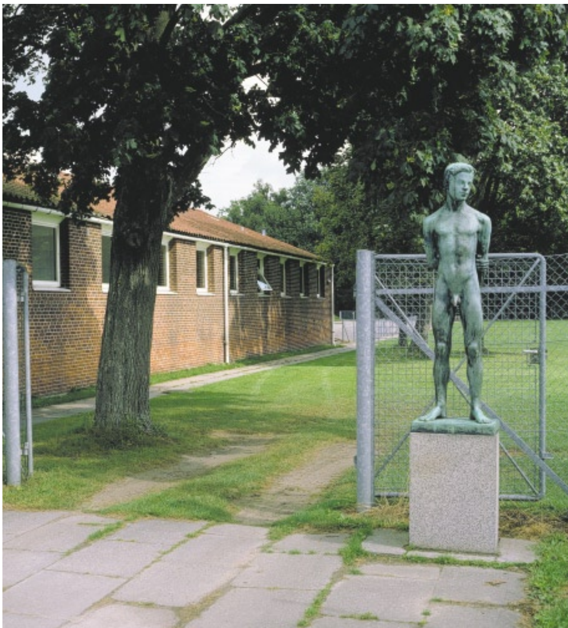
Den lange, lave murstensbygning er karakteristisk ved vinduernes placering helt oppe under taget.