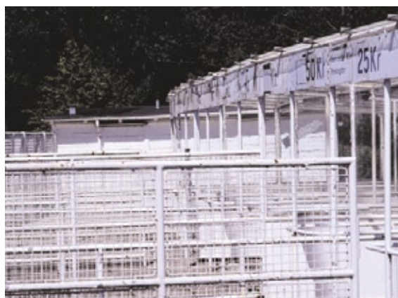
Stadionindgangens stålrørs båse rummer sin egen oversete æstetik.

Der var oprindeligt planlagt en svømmehal til Gentofte Stadion, men den blev opgivet. Først godt 30 år senere fik kommunen en svømmehal i det lille skovområde Kildeskoven, ca. 500 meter øst for den gamle Gentofte by. Kildeskovshallen, der udover en svømmehal rummer to boldspilshaller, et cafeteria og forskellige servicefaciliteter, blev opført i 1967-73.