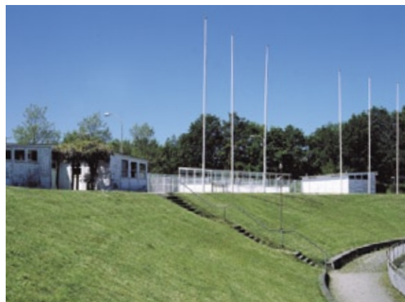
Gentofte Stadion er anlagt i en tidligere lergrav, hvor det omkalfatrede landskab har fået en ny anvendelse.

Sportsanlægget var i nogen grad forudbestemt af lergravens profil, og Arne Jacobsens væsentligste bidrag blev den lange, lave bygning, der rummer marketenderi, omklædning, baderum og rekvisitter. Bygningen, som blev opført 1941-42 og placeret