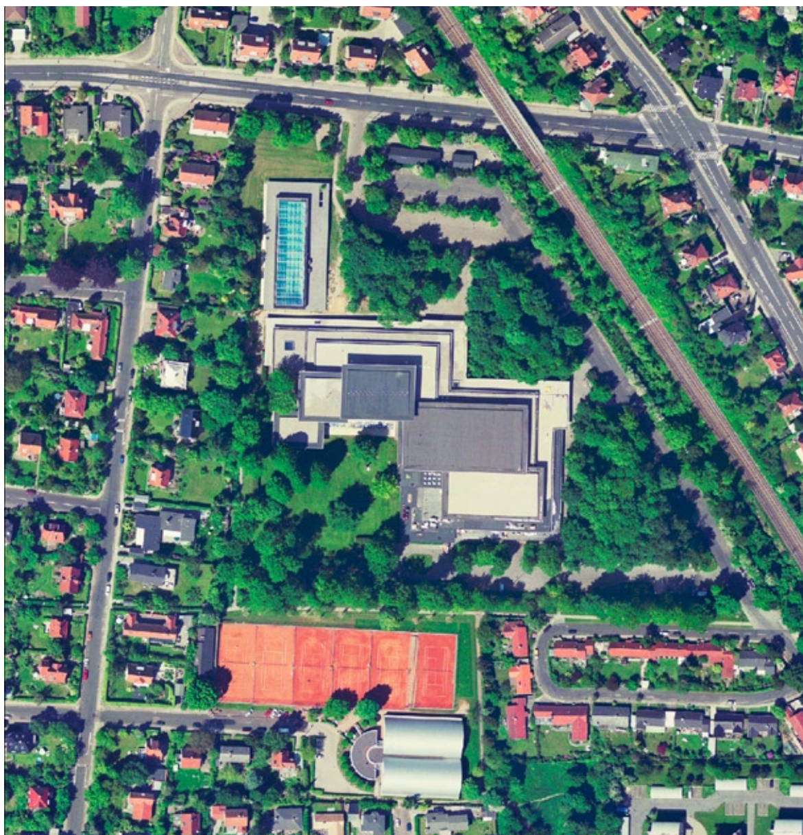
Orthofoto, Kildeskovhallen, 1:2500.

Til svømmehallen er der i 2002 opført en tilbygning med et 50 meter bassin. Tilbygningen, som er tegnet af Entasis Arkitekter på baggrund af en arkitektkonkurrence, føjer sig naturligt til det oprindelige byggeri og de skovagtige omgivelser.