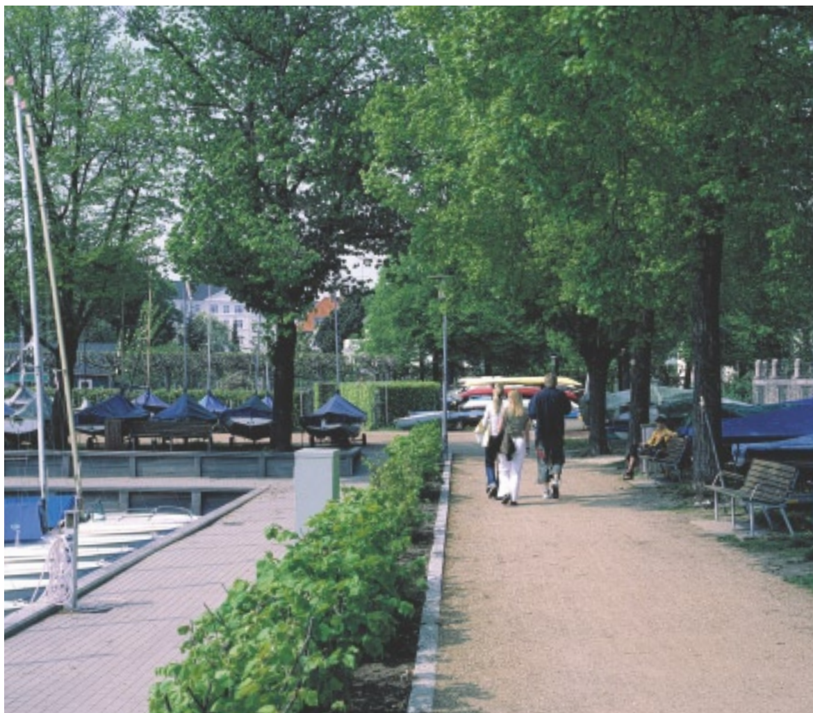
Hellerup Havn er et lille åndehul med sin egen afslappede og intime stemning.