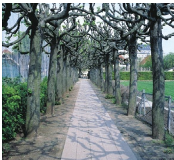
En klippet lindeallé adskiller staudehaven i Hellerup Strandpark fra de bagvedliggende tennisbaner. Alléen forbinder samtidig sejlkubbens domæne med de mere offentlige rekreative områder.

Hele anlægget, som er mindre end 2 ha, er i besiddelse af en intim og hyggelig atmosfære som ramme omkring havnens mange aktiviteter og de øvrige rekreative gøremål. Her er en tæt 'lilleby-stemning', som kan være vanskelig at opleve andre