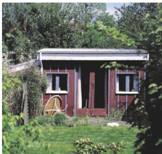
Havehus i Tuborg Haveby

Stedet fortæller om kolonihavefolkets flid og disciplin. Her bliver hækkene klippet til tiden og havehuset vedligeholdt. Et grønt område til pryd og nytte i en bydel med mange etageboliger.