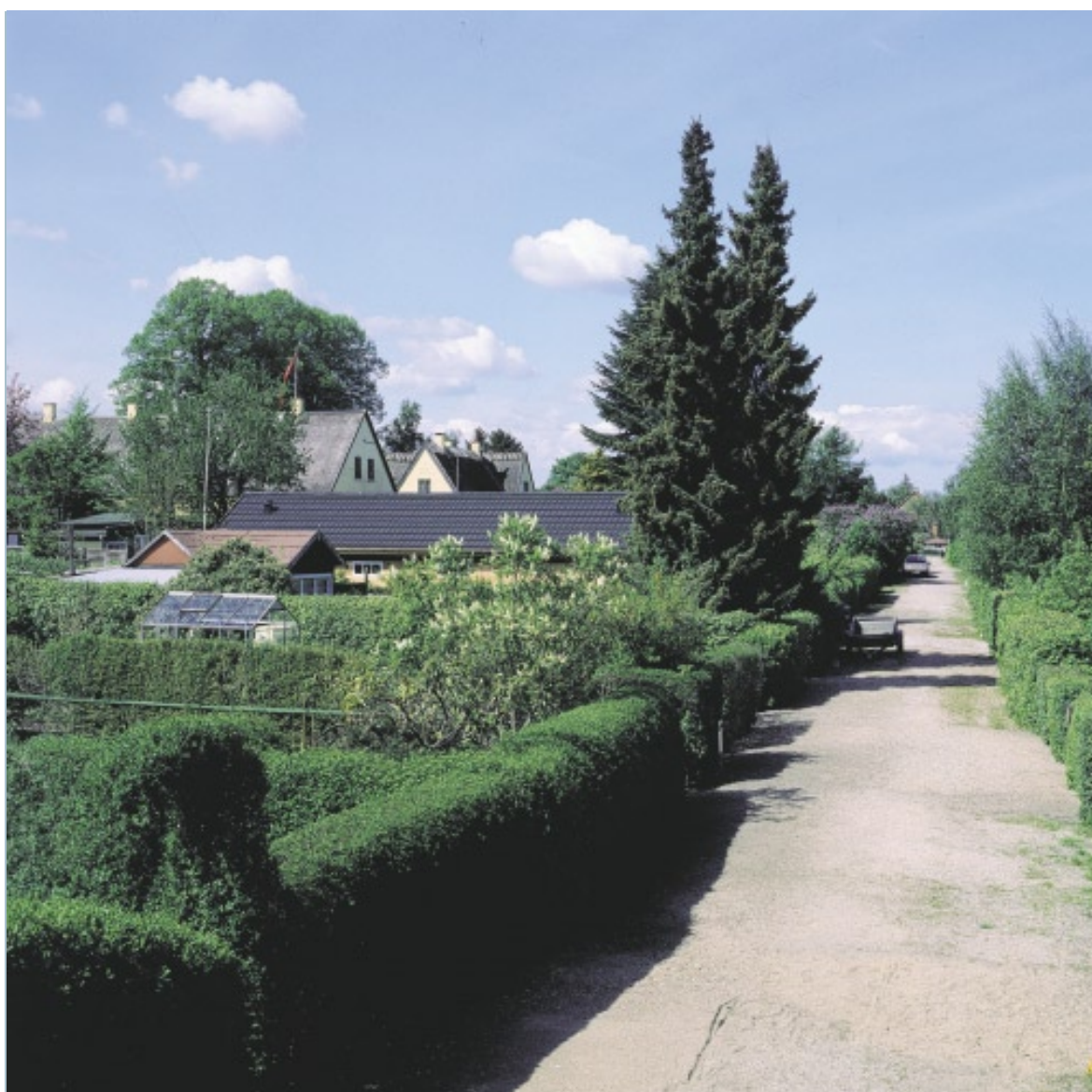
Tuborg Haveby er anlagt på Nordre Ellegårds jorder. Gårdens gulkalkede gavle skimtes til venstre i billedet.