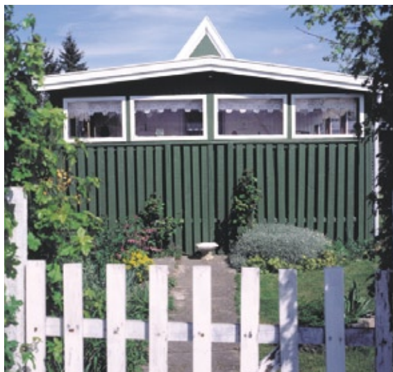
Haverne er velpassede med små pyntelige havehuse.

På en del af Nordre Ellegårds jorder, nord for Ellegårdsvej og med Gentofte Rende mod øst, er friholdt et område, som bryggeriarbejderne på Tuborg oprindeligt fik stillet til rådighed til kolonihaver. I området ligger resterne af gårdens oprindelige bygninger, der bl.a. indeholder enkelte boliger og samlingslokaler for haveforeningen. Omkring bygningerne står nogle store gamle træer, der rager op i det omkringliggende villakvarter og giver hele området karakter.