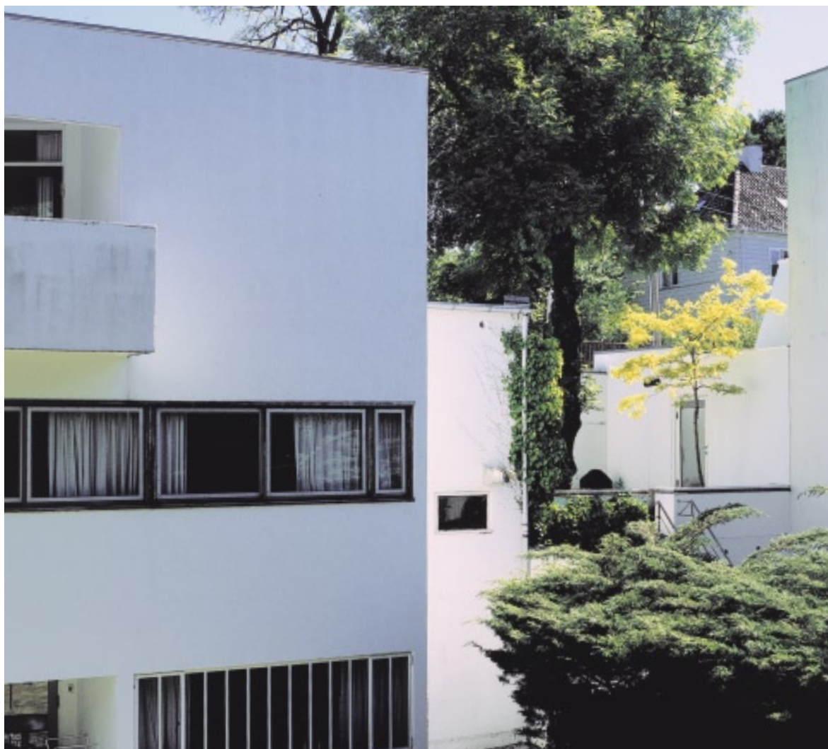
Sølystvej 7, som her ses fra havesiden, viser tydeligt Mogens Lassens inspiration fra Le Corbusiers Villa Savoye fra 1930 med den karakteristiske kubistiske form og de lange, smalle vinduesbånd.