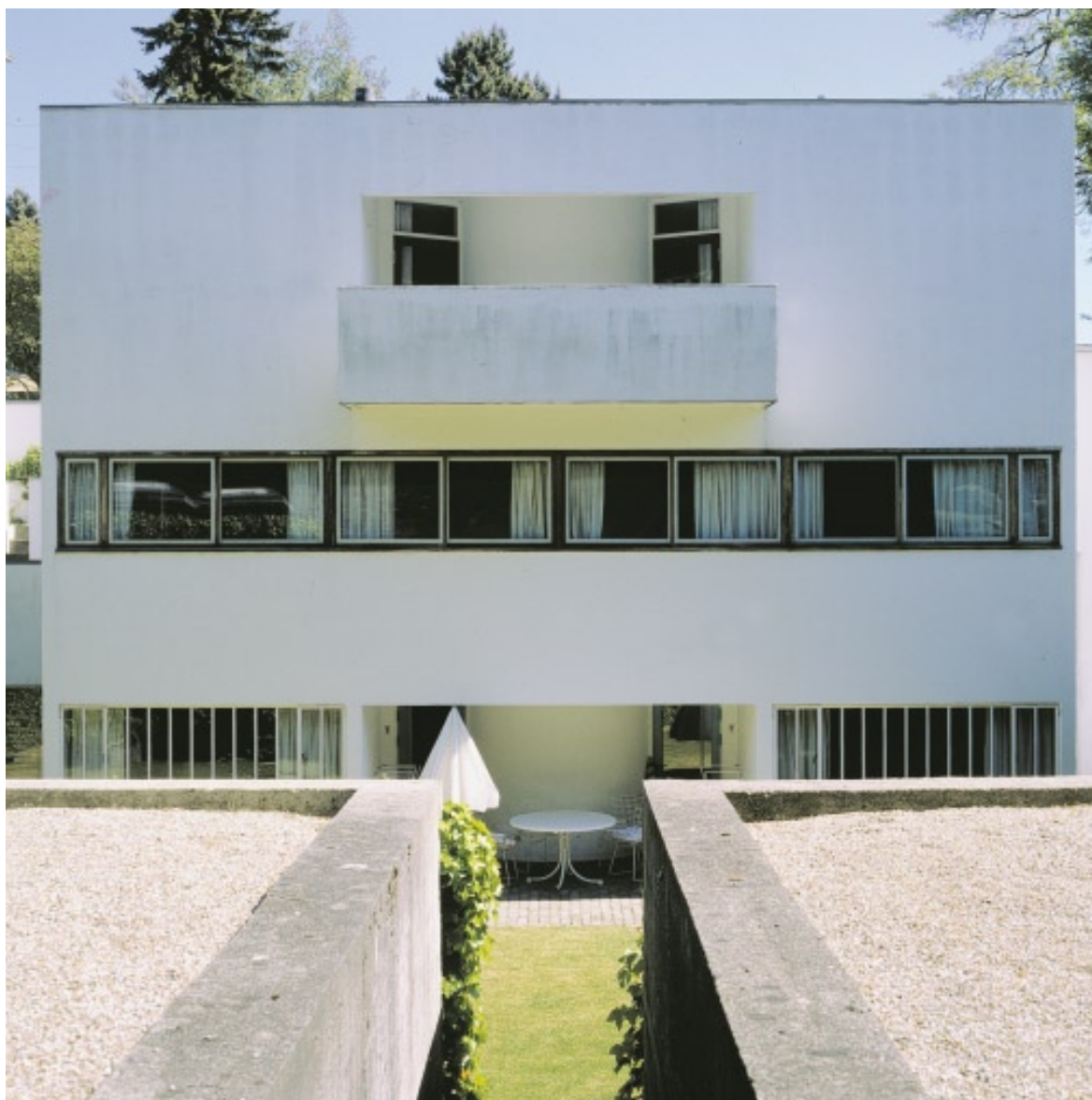
Sølystvej 7 er tilsvarende Mogens Lassens eget hus i nummer 5 tydeligt inspireret af den franske arkitekt Le Corbusier. Den kubistiske form, de glatte hvide overflader og de ubrudte vinduesbånd er alle lån fra den franske mesters tidligste arbejder.

På batteriets top ud mod Hvidørevej opførte Mogens Lassen to huse. Hvidørevej 24 er et lille mesterværk i rumlig disposition, hvor konstruktion, dagslys og materialer udgør rummets basale elementer. Hvidørevej 28 er det sidste af de seks huse, som Mogens Lassen opførte på Christiansholms Batteri. Det