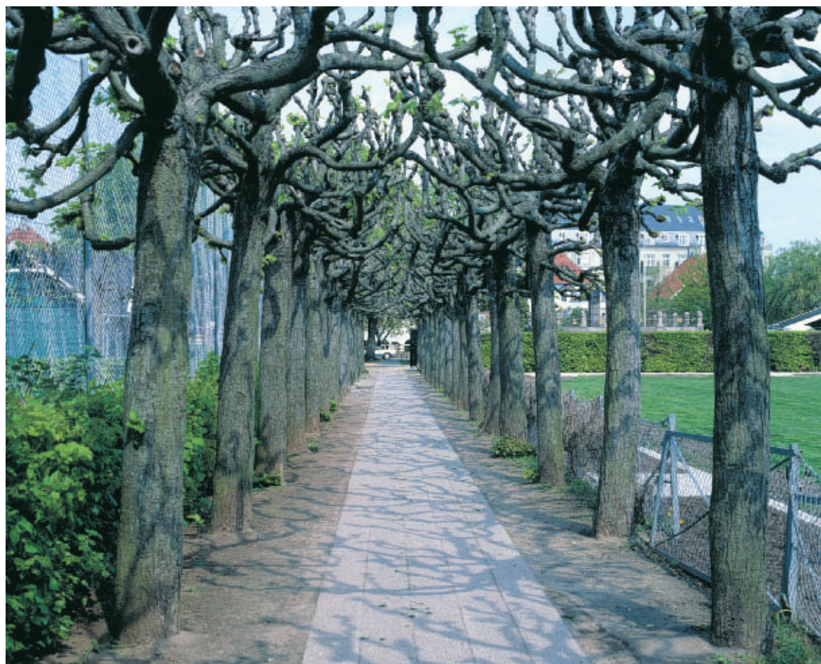
En klippet lindeallé adskiller stauedehaven i Hellerup Strandpark fra de bagvedliggende tennisbaner. Alléen forbinder samtidig sejlklubbens domæne med de mere offentlige rekreative områder.