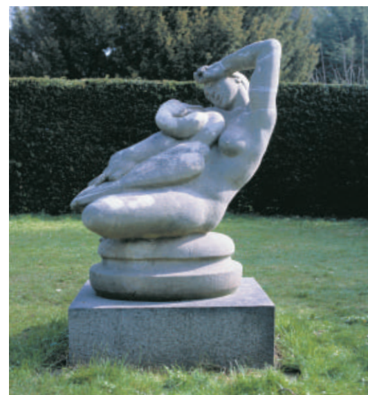
I Brandts Have ved Ordrup Kirkegård står denne lille skulptur af 'Leda med svanen' udført af billedhuggeren Kaj Nielsen.