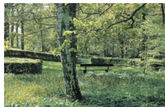
Det skovagtige og selvgroede i kontrast til det klippede og plejede er et af motiverne på Mariebjerg Kirkegård.