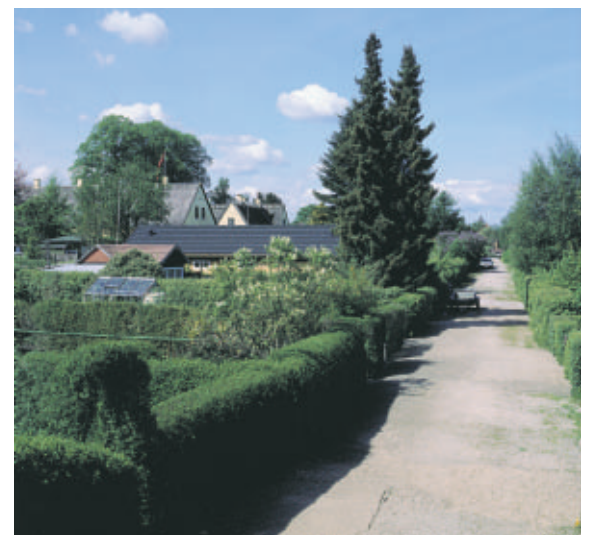
Tuborg Haveby er anlagt på Nordre Ellegårds jorder. Gårdens gulkalkede gavle skimtes til venstre i billedet.

Stedet fortæller om kolonihavefolkets flid og disciplin. Her bliver hækkene klippet til tiden og havehuset vedligeholdt. Et grønt område til pryd og nytte i en bydel med mange etageboliger.