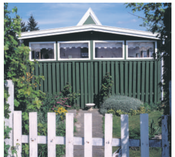
Haverne er velpassede med små pyntelige havehuse.