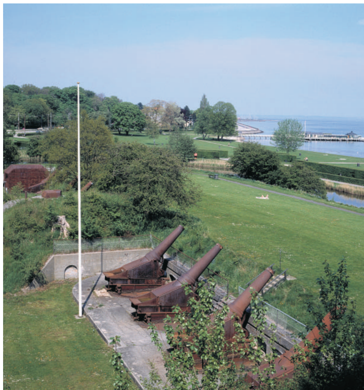
Fra Charlottenlund Fort er der fri udsigt over den foranliggende plæne og badeanstalten i det fjerne.