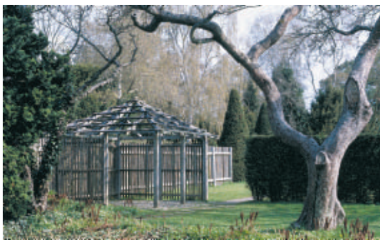
Brandts Have med skelettet af en gammel havehytte.