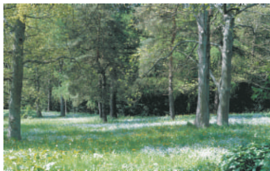
Mariebjerg Kirkegård er flere steder helt skovagtigt.