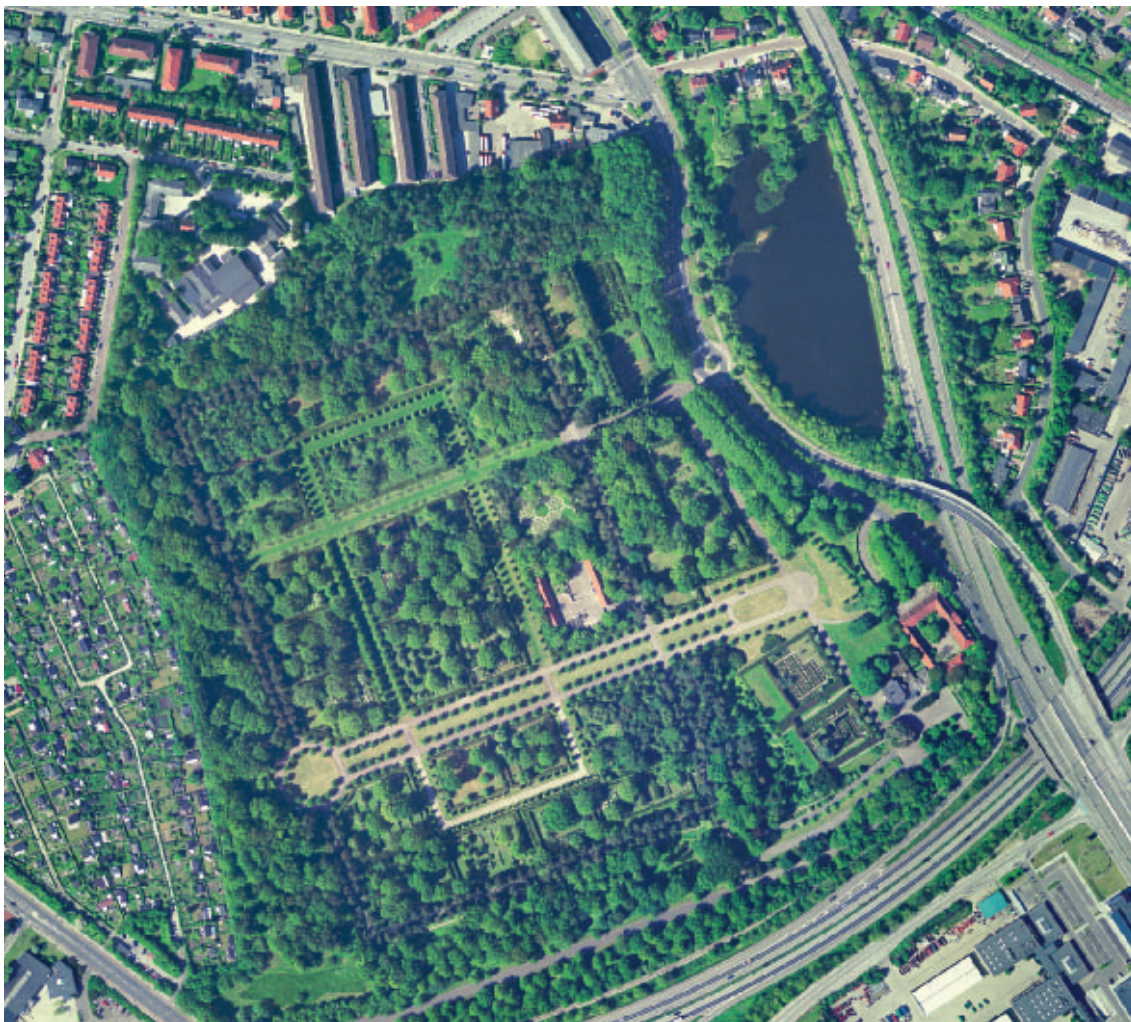
Mariebjerg Kirkegårds planudformning med de to store tværgående akser, som skærer de to mindre rektangulære alléer ses tydeligt på luftbilledet. Kapellet er beliggende i kirkegårdens nederste højre hjørne ved siden af Vintappergården.