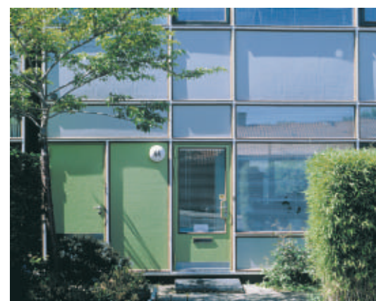
Rækkehusene på Sløjfen fra 1957 fremstår lette og elegante med deres spinkle facadeprofiler.