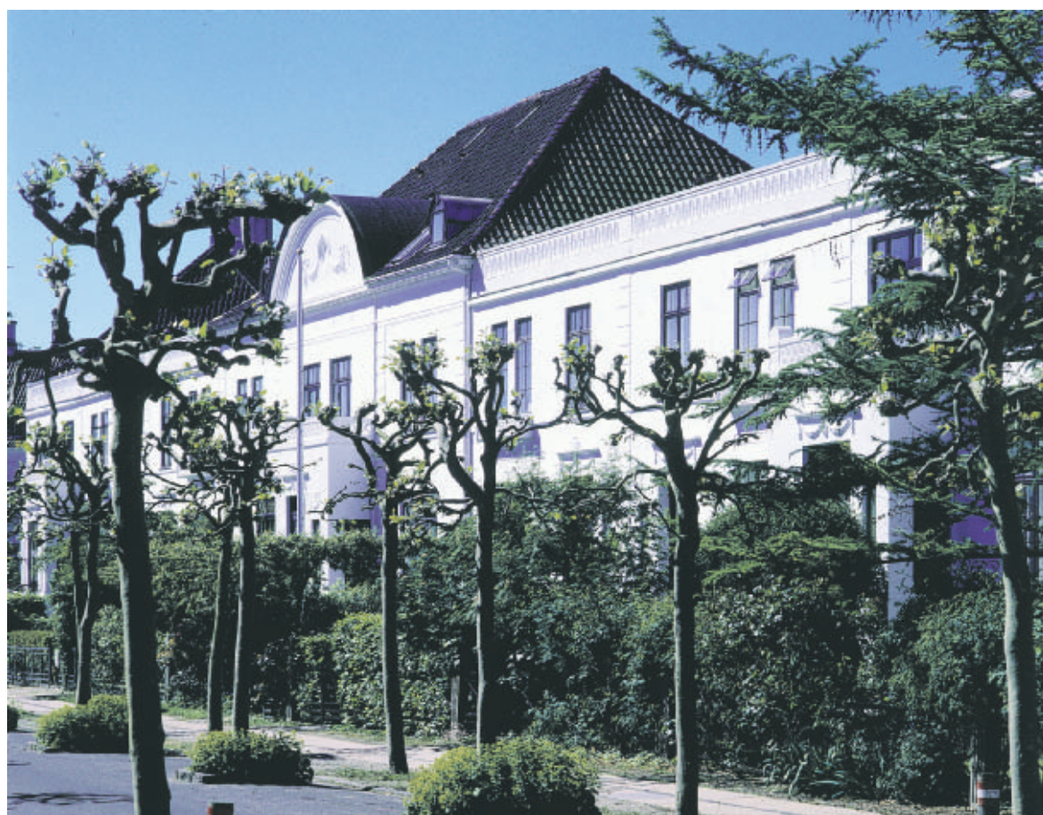
De engelske Rækkehuse nord for Christiansholm adskiller sig med de hvidpudsede facader og den sammenbyggede karréform markant fra den omliggende villabebyggelse.