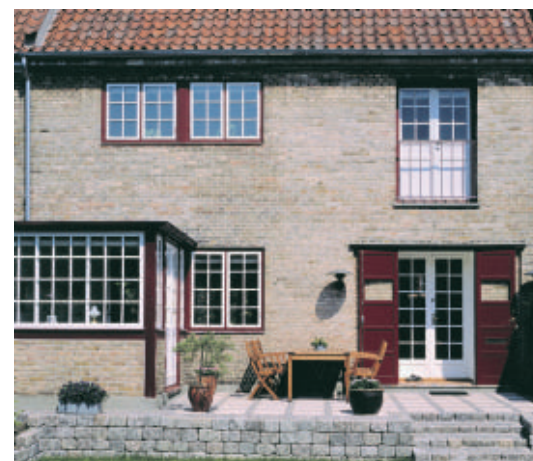
Sundvængets rækkehuse er opført som store og rummelige boliger i to etager.

Ved den korte vej Sløjfen, der ligger på et restareal mellem sammenfletningen af Helsingørmotorvejen, Motorringvejen og Lyngbyvejen samt Nordbanen, ligger to serier rækkehuse, tegnet af Arne Jacobsen. Den første serie, Sløjfen 21-35, blev opført i 1943 som funktionærboliger for NOVO - i en tid, hvor en bil på vejen var en oplevelse, som kunne ses nede på Helsingørvejen, 15 meter fra husenes haveside. I enderækkehuset havde Arne Jacobsen sin anden bolig i Gentofte fra 1945 til 1951. Husene er opført med en rummelig plan i traditionelle materialer med røde tegl til mur og tag. Den anden serie, Sløjfen 22-48 samt Ørnegårdsvej 22-50, er fra 1957, med 29 toetages huse i tre rækker. De er opført med indre bærende tværvægge og lette facadevægge, de såkaldte 'curtain-walls'. Facaderne er udført af spinkle træprofiler og udfyldt med vinduer, malede eternitplader og indgangsdøre. Husenes delikate fremtoning har næsten et møbels karakter. Det er formentlig første gang denne facadekonstruktion blev anvendt i Danmark.