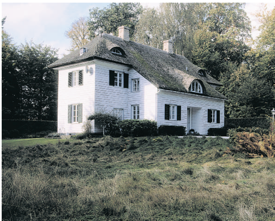
Skovgårds hovedbygning, som i dag er beliggende på Krathusvej 36, er et charmerende træbeklædt hus med et lavt helvalmet stråtag. Til gadesiden står huset i to etager i en symmetrisk og klassicistisk udformning. Til havesiden er huset med sit fremskudte og lave midterparti udformet i engelsk cottage-stil.

Ordrup Krat var i 1920'erne genstand for en heftig fredningsdebat, idet der var fare for, at Dyrehavens sydgrænse ville blive bebygget lige så voldsomt som Dyrehavevej vest for Klampenborg Station. Det lykkedes at frede området og få bebyggelsen til at respektere resterne af skoven.