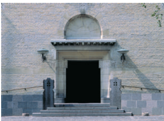
Hellerup Kirke er tegnet af Thorvald Jørgensen i 1900.