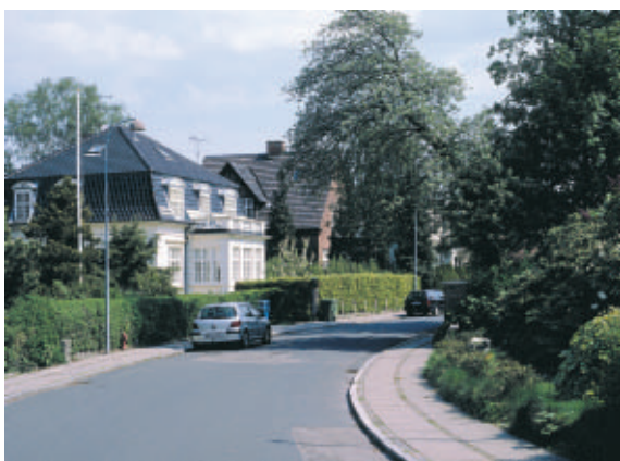
Vest for Hellerup Kirke ligger et ældre villaområde med kurvede gader og store huse.