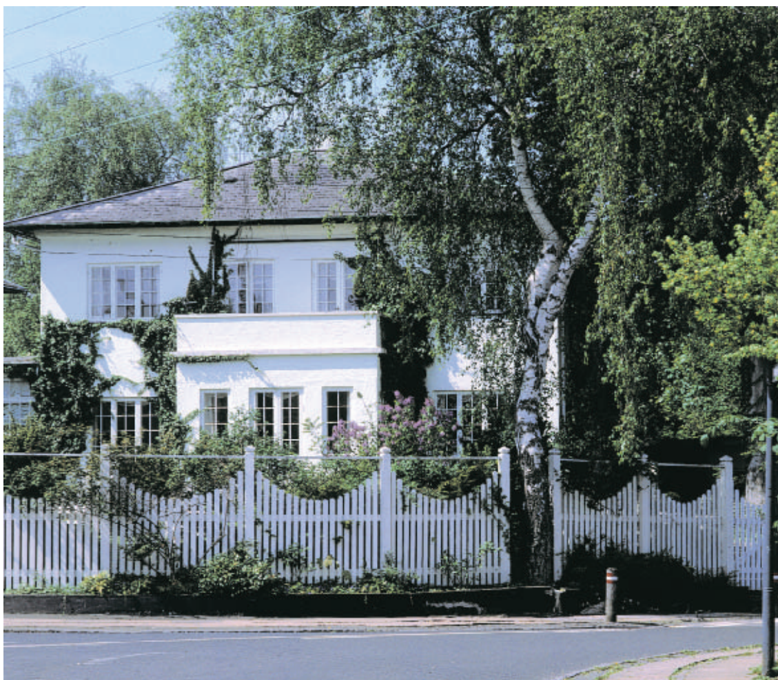
Store, rummelige villaer sætter deres præg på Margrethevej.

Et ældre villaområde vest for Hellerup Kirke er opført langs slyngede småveje. Områdets herskabelige huse ligger tilbagetrukket fra vejen og omgivet af smukke gamle haver.