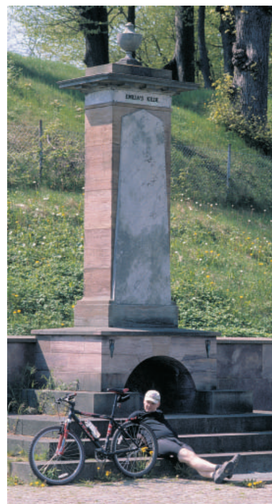
N.A. Abildgårds mindesmærke 'Emilias Kilde' ses på hjørnet af Emiliekildevej og Strandvejen.