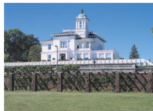
Landstedet Hvidøre er et markant hus, som er særdeles synligt nede fra Strandvejen.