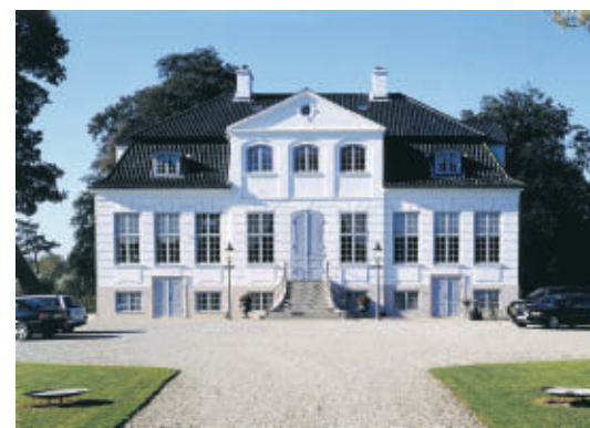
Det nuværende Christiansholm er opført i 1746 som en 9 gange 7 fags bygning med midtrisalitter på alle fire facader.