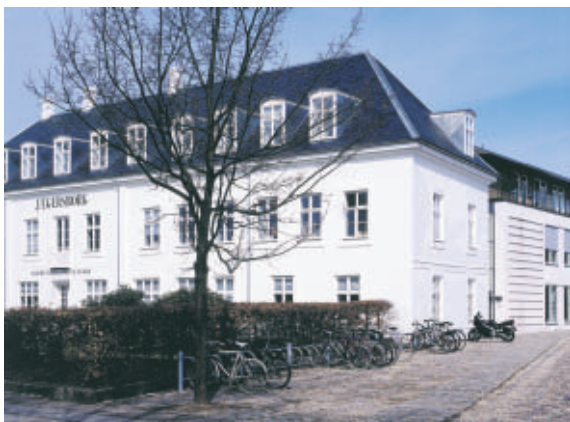
Det tidligere Jægersborg Hotel udgør med sine hvide facader og sit høje, sorte tag en markant afslutning af det åbne areal ved Meutegårdsvej.

Komplekset af bygninger omkring Jægersborg Kaserne tiltrækker sig naturligt opmærksomheden ved de mange forskellige bygningers iøjenfaldende kvaliteter.