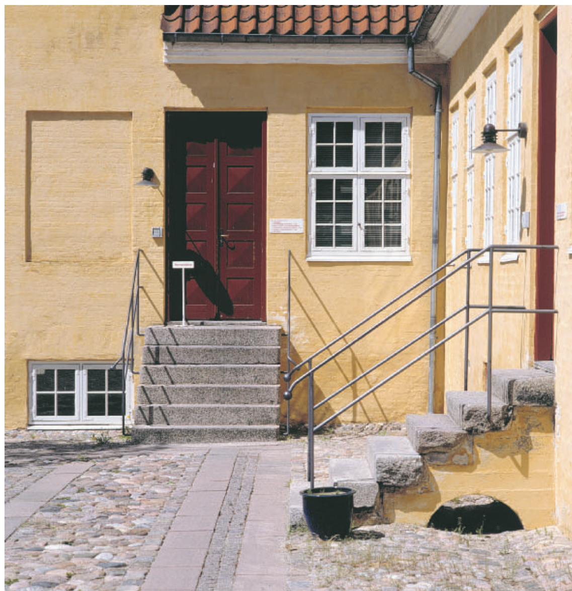
Generalbygmester Laurids de Thurahs Jægergården er et velproportioneret bygningsværk med mange udsøgte og robuste detaljer.