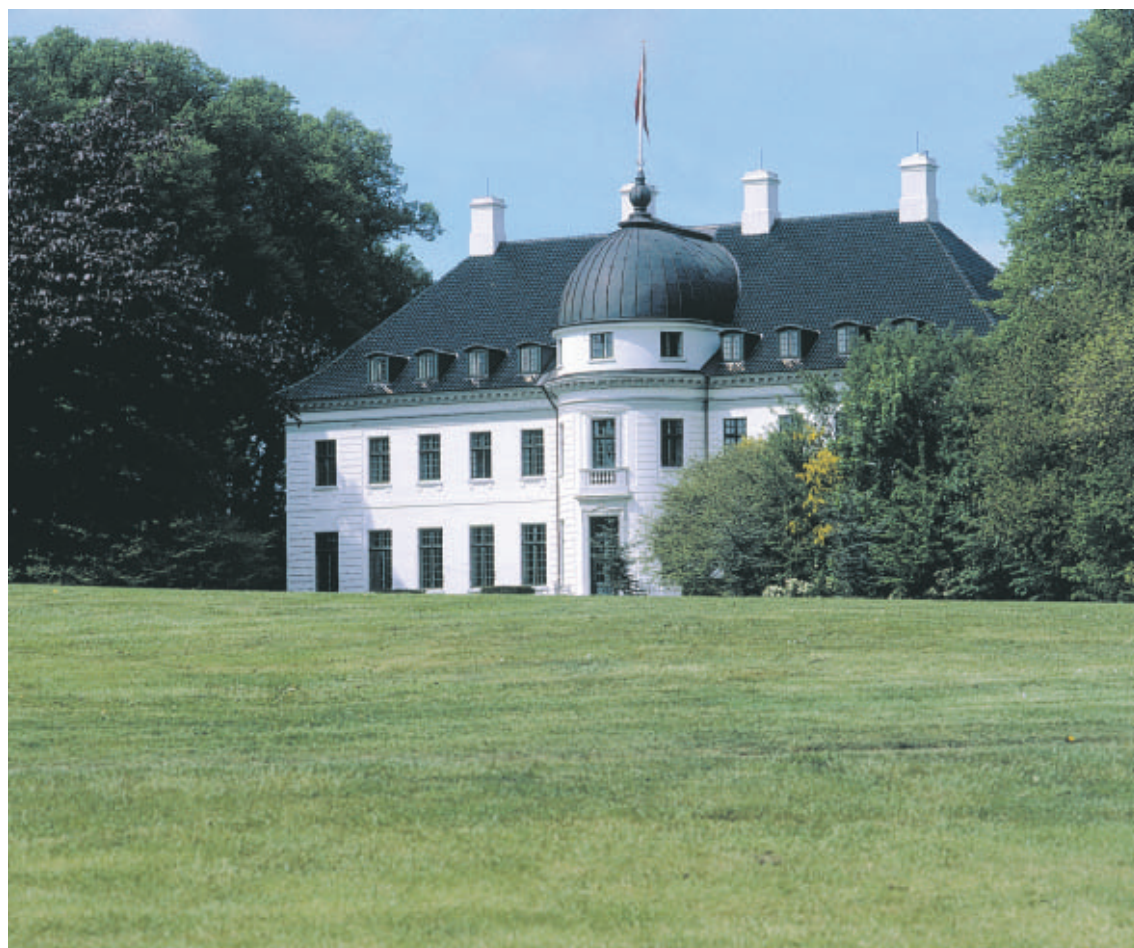
Bernstorff Slots havefacade domineres af den halvrunde midterbygning, hvis store kuplede tag foroven afsluttes med en lille overbygning, der bærer flagstangen.