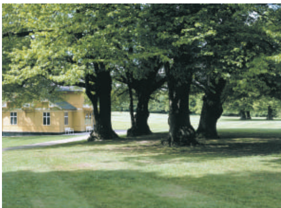
Den gule 'svenske villa' ses delvis skjult af en gruppe fritstående træer i Bernstorffparken.

Centralt placeret i Gentofte Kommune ligger Bernstorffparken med slot og tilhørende økonomibygninger. Et stort, smukt og sammenhængende park- og skovområde med slottet som den absolut mest betydningsfulde bygning.