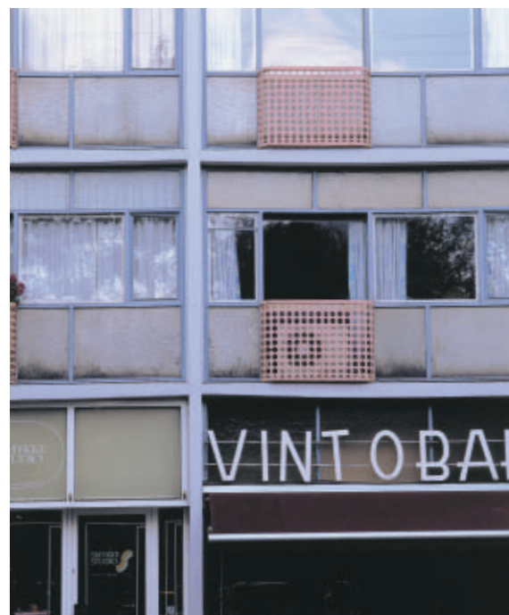
Systemhusets bærende tværskillevægge er lige tykke i hele husets højde