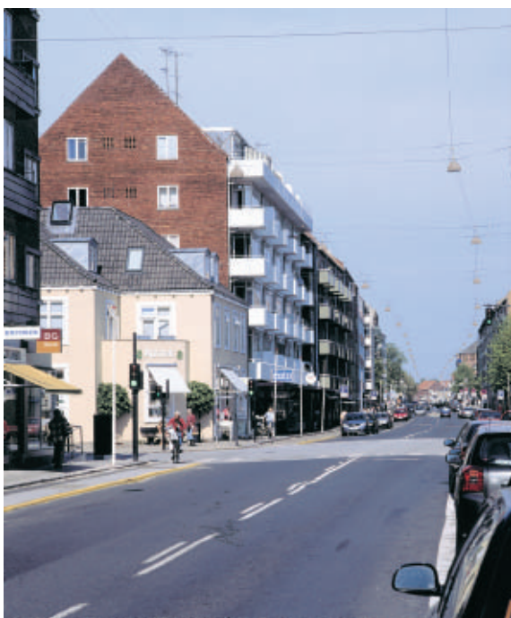
Ordrupvejs facadehuse varierer stærkt i alder, størrelse og profil.