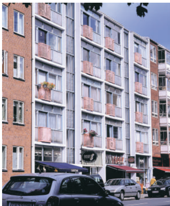
Systemhuset på Ordrupvej 70 opførtes oprindeligt som et byggeteknisk eksperiment.