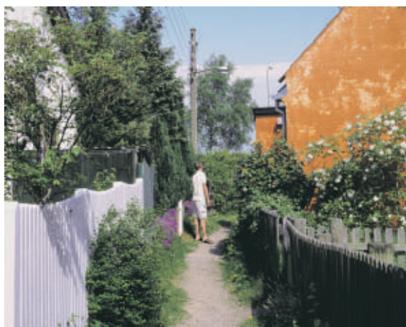
De smalle slipper, der løber vinkelret på Strandvejen ned mod kysten er et karakteristisk byelement i Skovshoved.

Hvor Strandvejen løber mod nord fra det åbne stykke ved Charlottenlund Skov, markerer den gamle, runde ventesal og kioskbbygning, den nuværende café Jordan Rundt, at vi nærmer os fiskerlejet Skovshoved. Strandvejen følger herfra i et let buet forløb stenalderskrænt. Med Villa Skovbakken eller Carl Petersens Kollegium højt hævet oppe på skrænten og snart efter det gamle Skovshoved Hotel er vi fremme ved fiskerlejet.