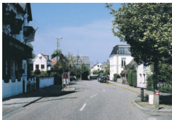
Strandvejen gennem Skovshoved er med sine mange bugtninger og indsnævninger ikke velegnet til gennemkørende trafik.