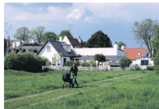
Grønningen øst for fiskerlejets småhuse er udlagt på det opfyldte terræn som fremkom ved Kystvejens etablering.