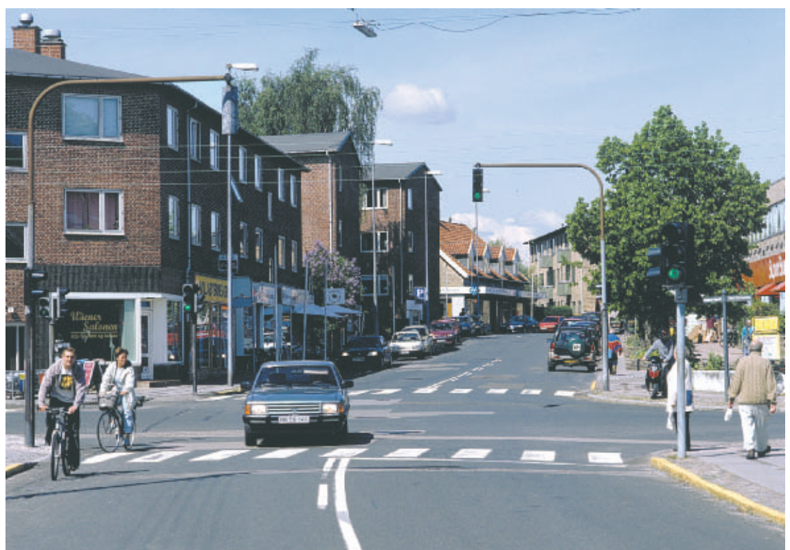
Vangede Bygade er et livligt butiksstrøg med en noget sammensat bebyggelse, der er domineret af tre etagers boligblokke.