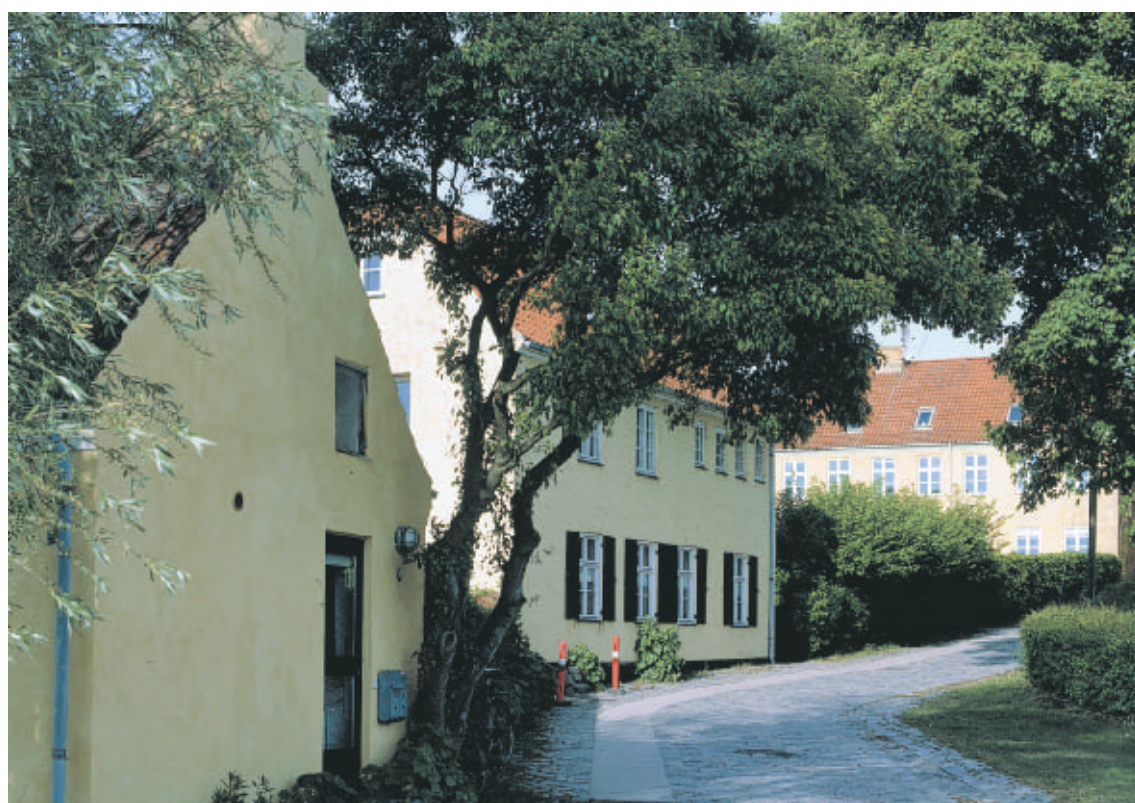
I bunden af Mitchellsstræde nede ved Gentofte Sø danner de gule huse sammen med de høje træer et charmerende og intimt miljø.