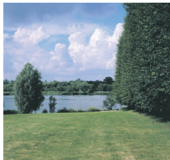
Landsbyen Gentoftes fælles græsningsarealer ned mod Gentofte Sø udgør i dag et rekreativt område i en tæt-befolket bydel.

Gjentoftegade løber på en nord-sydgående bakkekam parallelt med Gentofte Sø. Den gamle landsby lå langs gaden med en udstrækning fra torvet mod syd ved Søgaardsvvej og Baunegårdsvej til Kirketorvet mod nord. Landsbyens fælles græsningsarealer lå på det skrånende terræn ned til søen. Det store grønne areal, som i dag står med spredte trægrupper, udgør med sin bymæssige tilknytning et stort rekreativt område, Gentofte Park.