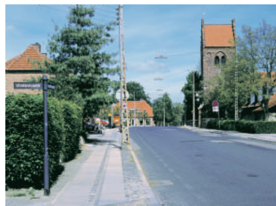
Gentofte Kirke ligger på Gentoftegades højeste punkt.

Gentofte Kirke er den ældste bygning i kommunen. Den kan dateres tilbage til 1176. Sognets udstrækning svarede nogenlunde til det, der i dag udgør Gentofte Kommune. Gentofte kirke er den eneste kirke i kommunen, som er omgivet af en kirkegård. Kirken ligger 31 meter over havets overflade. Indtil for blot 100 år siden kunne man fra glamhullerne i tårnet se ud over hele kommunen.