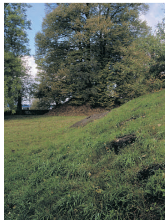
Twillingehøjene øverst på Stolpegårdsvej ligger frit tilgængelige i 'Stolpegårdens' have. Et stort solitært træ rejser sig over den nordligste høj.