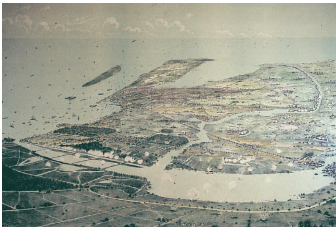
Det befæstede København under et tænkt angreb. På billedet ses Nordre Oversvømmelse fra Bellevue til Ermelunden og Søndre Oversvømmelse fra Ermelunden over Gentofte Sø til Utterslev Mose. Kongevejen fra København til Lyngby og Jægersborg Allé ses tydeligt midt i billedet. I det fjerne ses Amager før tillægget af Kalvebod Fælled. Efter tryk af Franz Sedivy, 1887. Byhistorisk Samling, Lyngby-Taarbæk Kommune.

Mange af disse anlæg er i dag udlagt som rekreative områder. Et enkelt anlæg fik en helt speciel anvendelse, idet arkitekt Mogens Lassen i 1930'erne opførte en række villaer på Christiansholms Batteri.