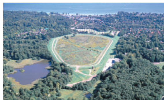
Galopbanen ligger midt i stenalderhavets 'Klampenborg Fjord'.

Kystkrænterne står stadig særdeles tydelige i landskabet og kan blandt andet ses umiddelbart vest for Strandvejen gennem Skovshoved. Fra Traverbanevejen og til Tuborg følger Strandvejen i det store og hele stenalderhavets kystlinie.