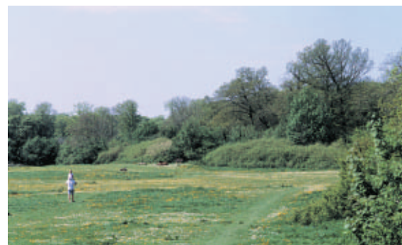
Ermelundssletten ligger lavt med skovbryn til alle sider.